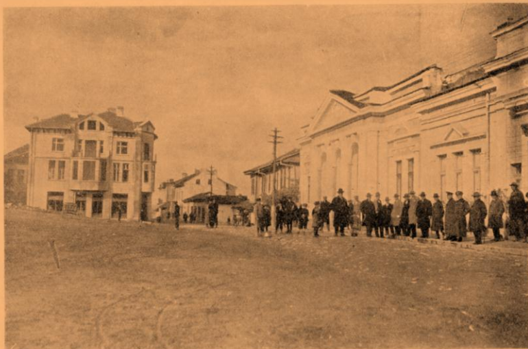
Към входа за главната улица

Население (по преброяването от 1926 год.) – 43318; Избиратели – 12147; Села (с 2 махали) – 55; Общини – 29; Първоначални училища – 55; Прогимназии – 9; Непълни смесени гимназии – 1 (Белоградчик); Медицински лекарски участъци – 9; Медицински фелдшерски участъци – 5; Ветеринарни лекарски участъци – 1 (Белоградчик); Ветеринарни фелдшерски участъци – 5.