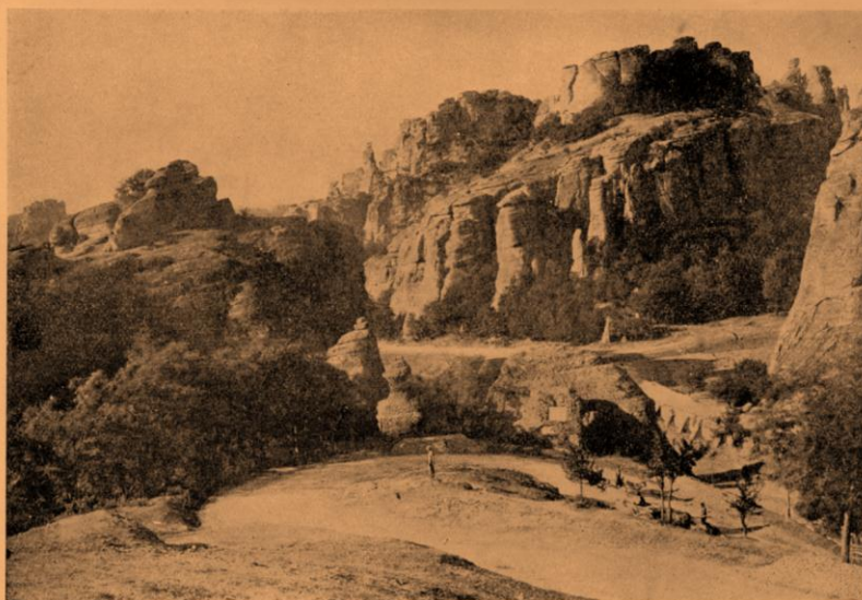
Дефилето — надоле