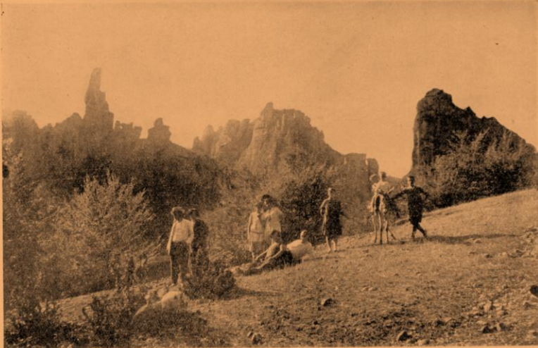
И писателъ Анто́нъ Страши́мировъ, семейно, е всрѣдъ група скали.