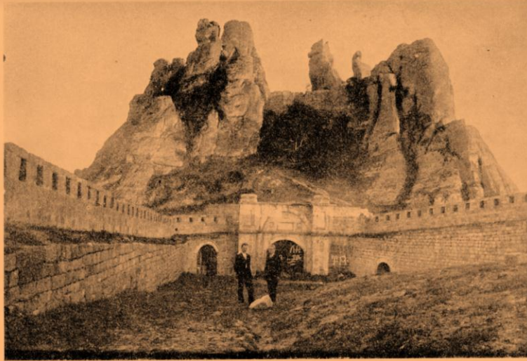
Часть отъ голъмата крепость