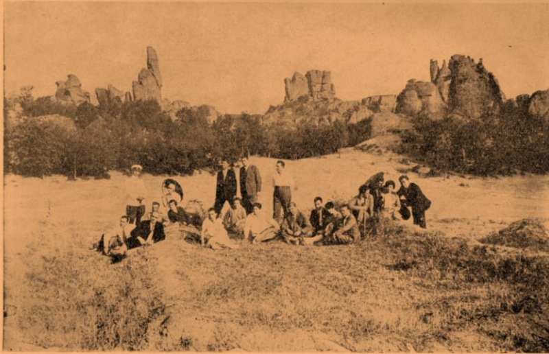
Друга група скали при „Субашинь“