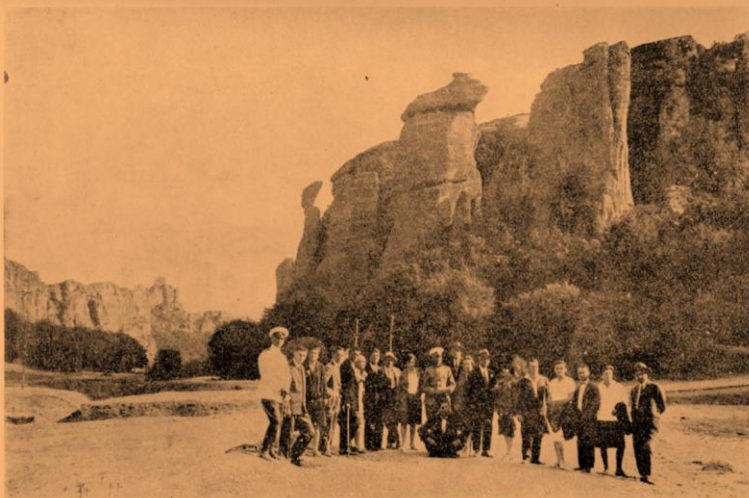
Дефилето — при „Дервиша“