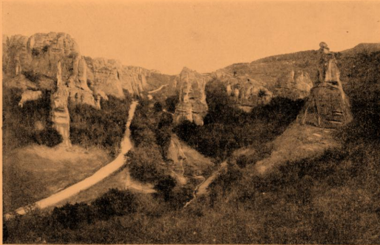
Дефилето — нагоре