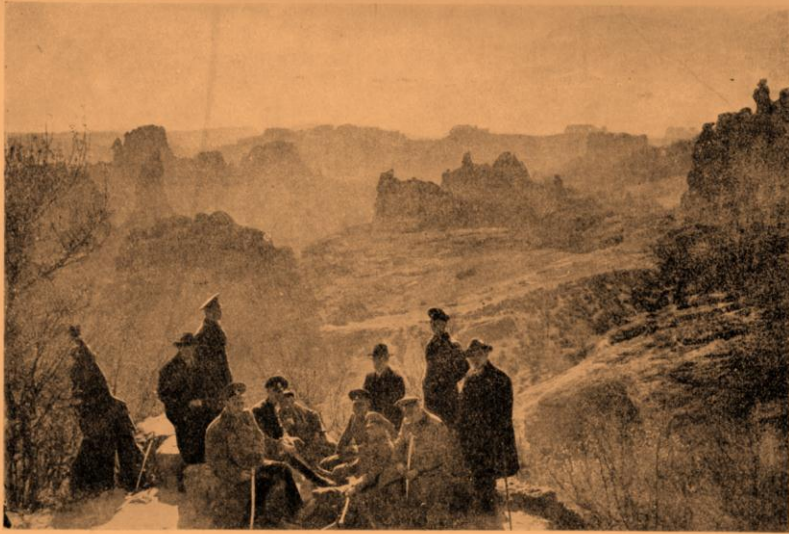
Изгледъ отъ къмъ „Мисленъ камъкъ“