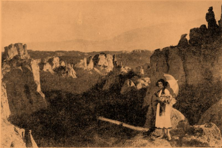
Друга група скали по дефилето