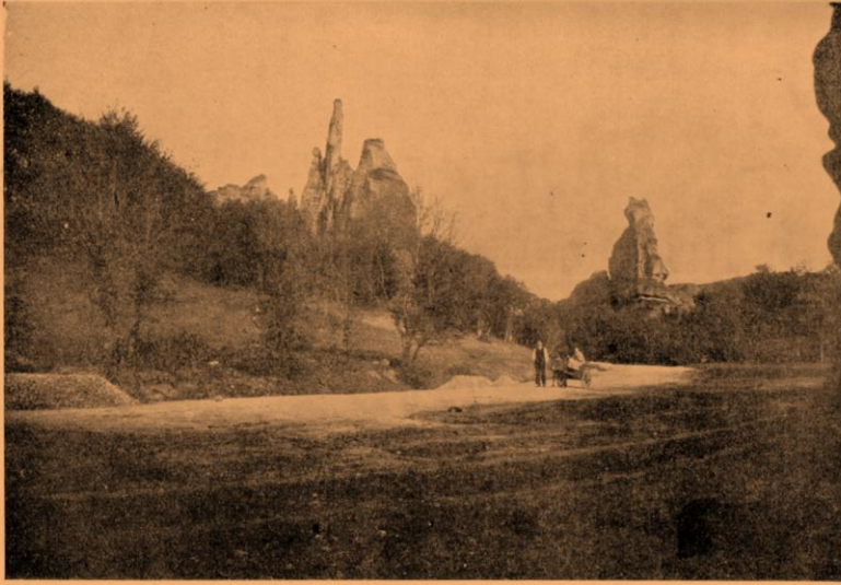
Дефилето — подъ „Субашинъ“