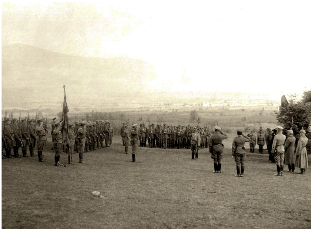
Празник на 15-и пехотен Ломски полк в с. Цапари, до Битоля (на заден план е Червената стена)

Цветята са пожълтели и увехнали. Аз винаги очаквам с разперени ръце и копнееща душа на любовта царството на мира. Тогава ти ще бъдеш пак при мене ... ти за мене си един малък свят, чрез когото обикнах света.“