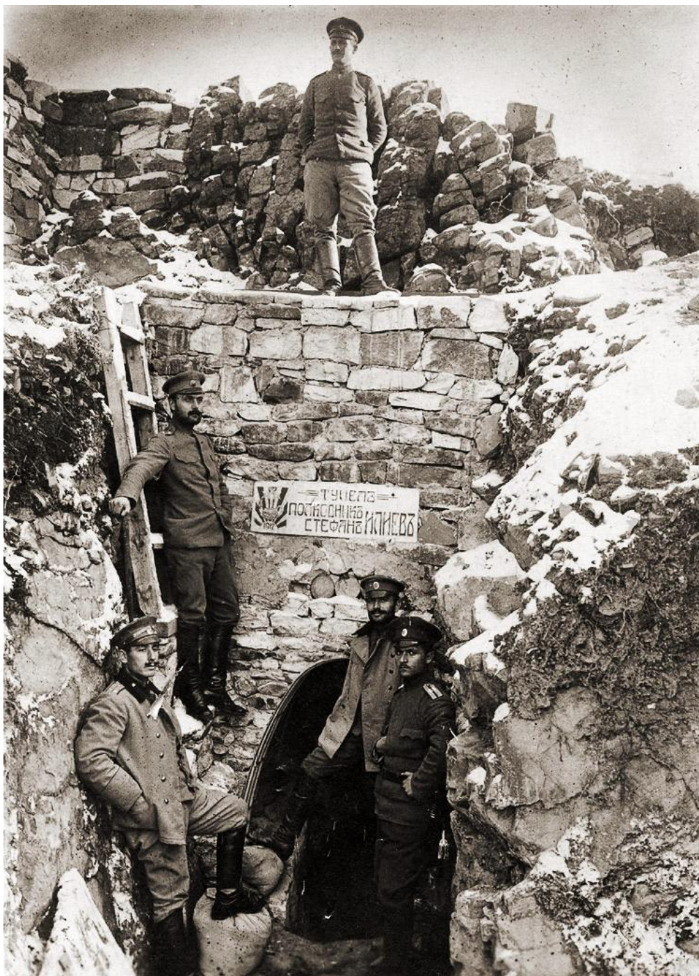
15-и пехотен Ломски полк на Червената стена

нашата земя, стойте винаги на крака и бдете за изгряващото из мрака човешко съзнание за мир и свобода на света.“