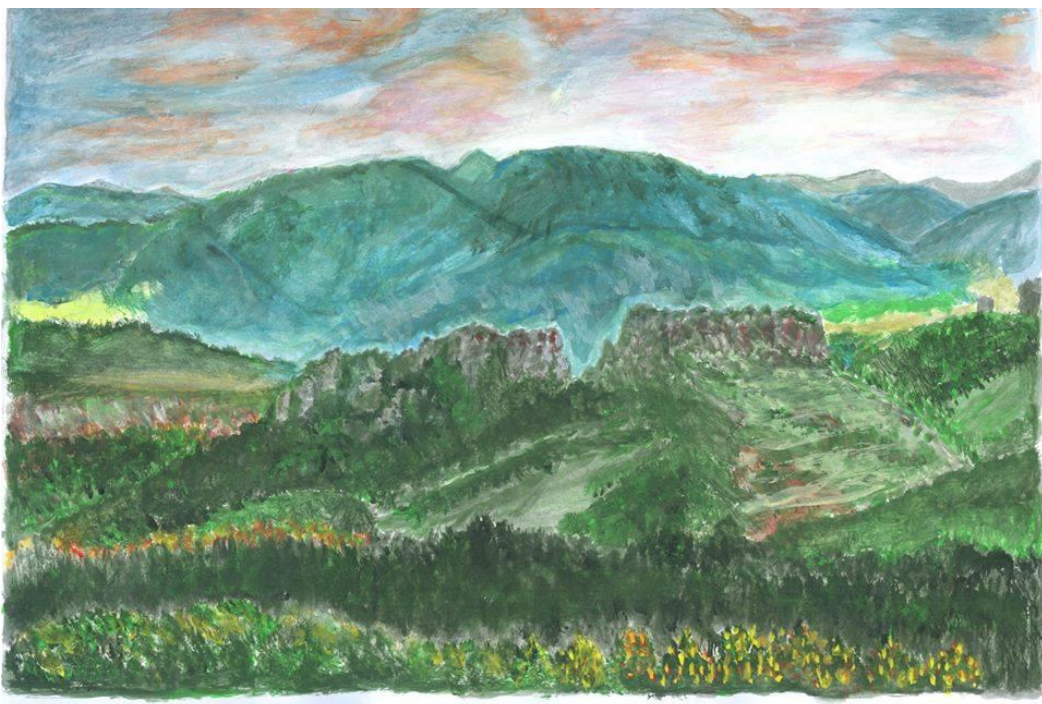
НА ДЪЩЕРЯ МИ