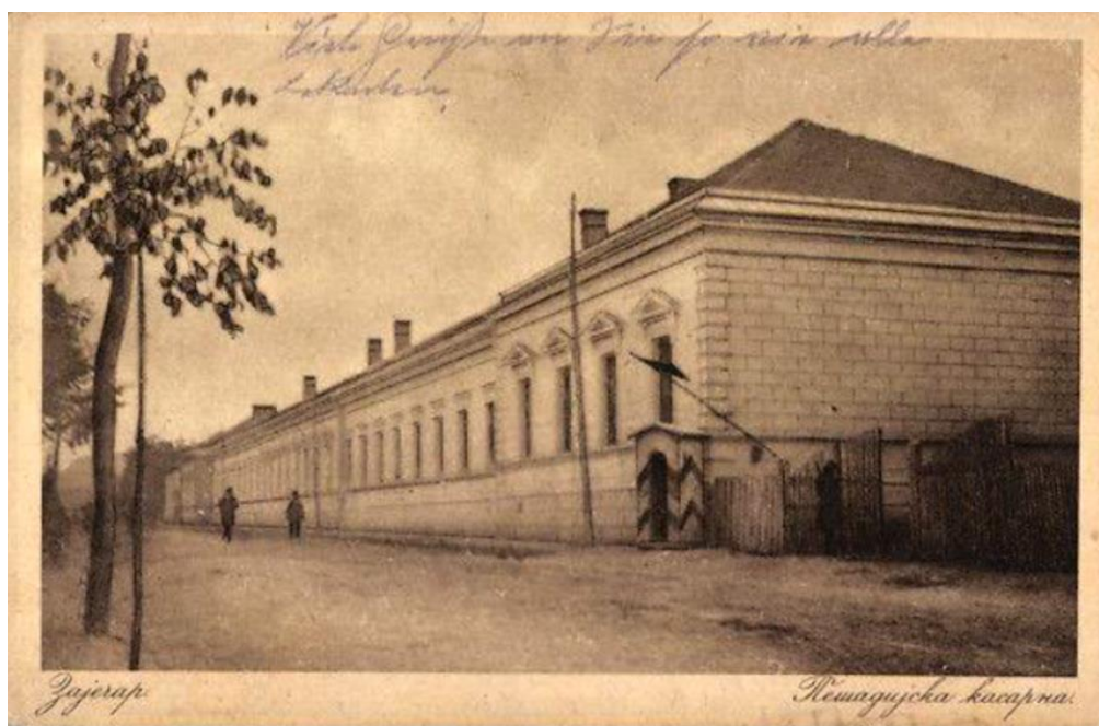
Пехотната казарма в Зайчар 1)

След превземането на Зайчарския укрепен лагер и самия Зайчар, след 14 дневни упорити ожесточени боеве от 1 до 14 октомври 1915 год., полкът настъпи победоносно във вътрешността на Сърбия. На всяка крачка сърбите се стремяха да задържат и разбият настъпващите като лъвове българи, с надеждата, че ще дойде подкрепление от Солун.