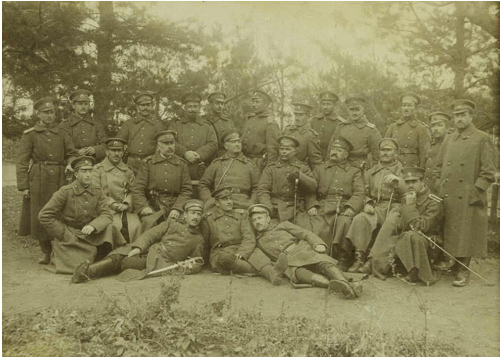
Март 1917 г. – офицерите на полка при Червената стена