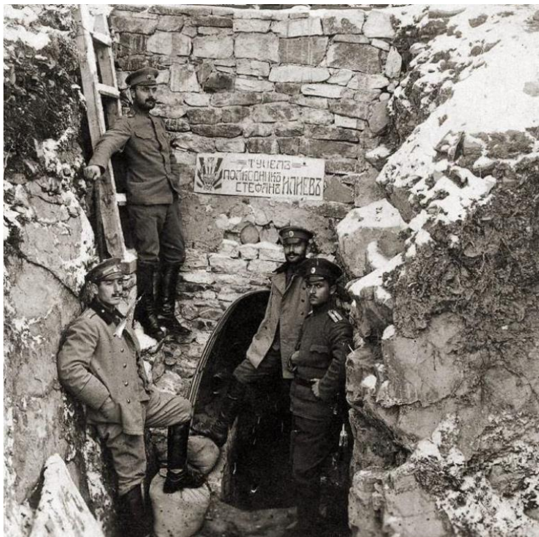
Под Пелистер, 1917