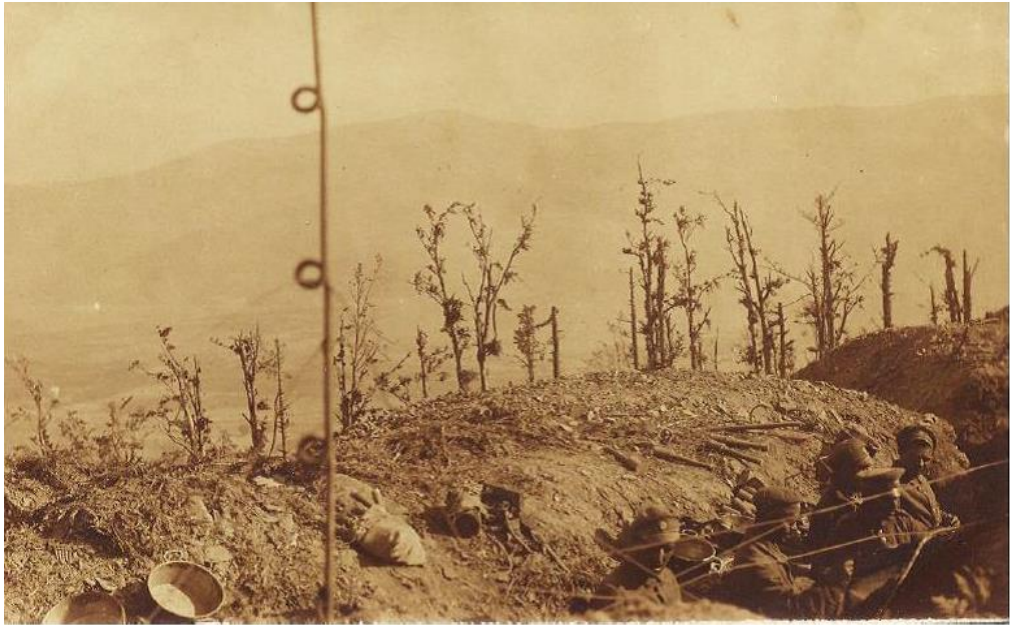
Позиция на полка на Червената стена