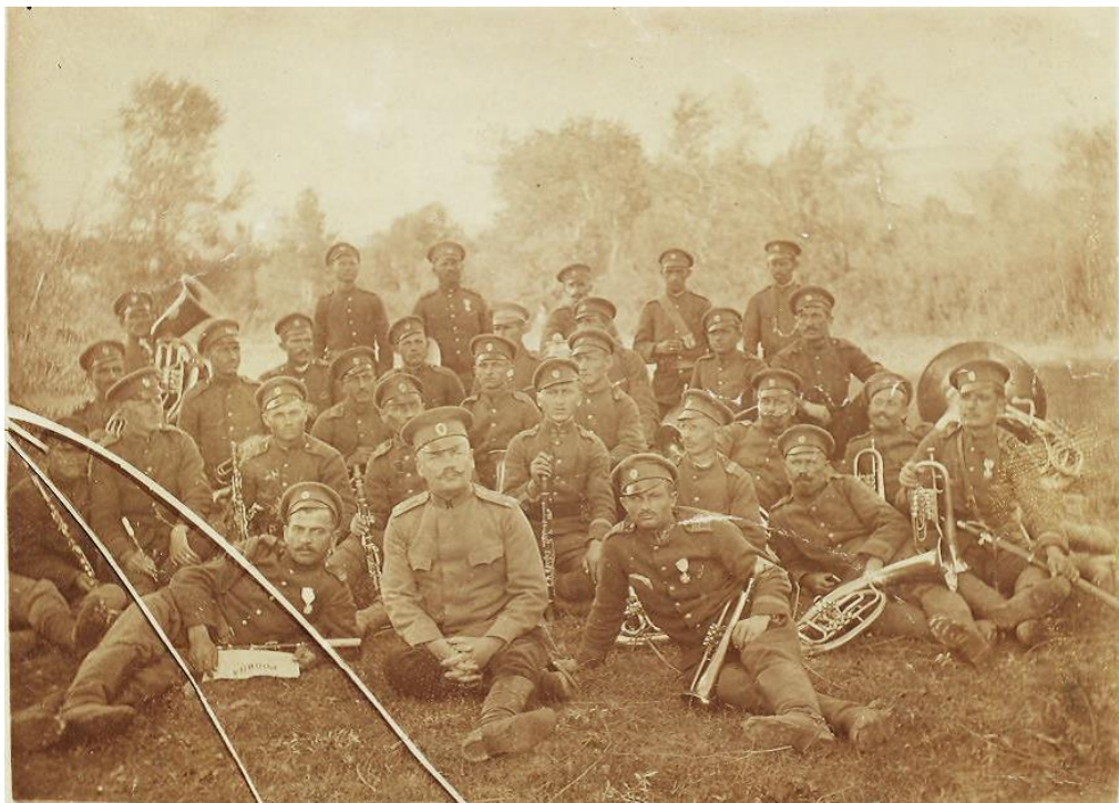
Военната музика на полка на Червената стена