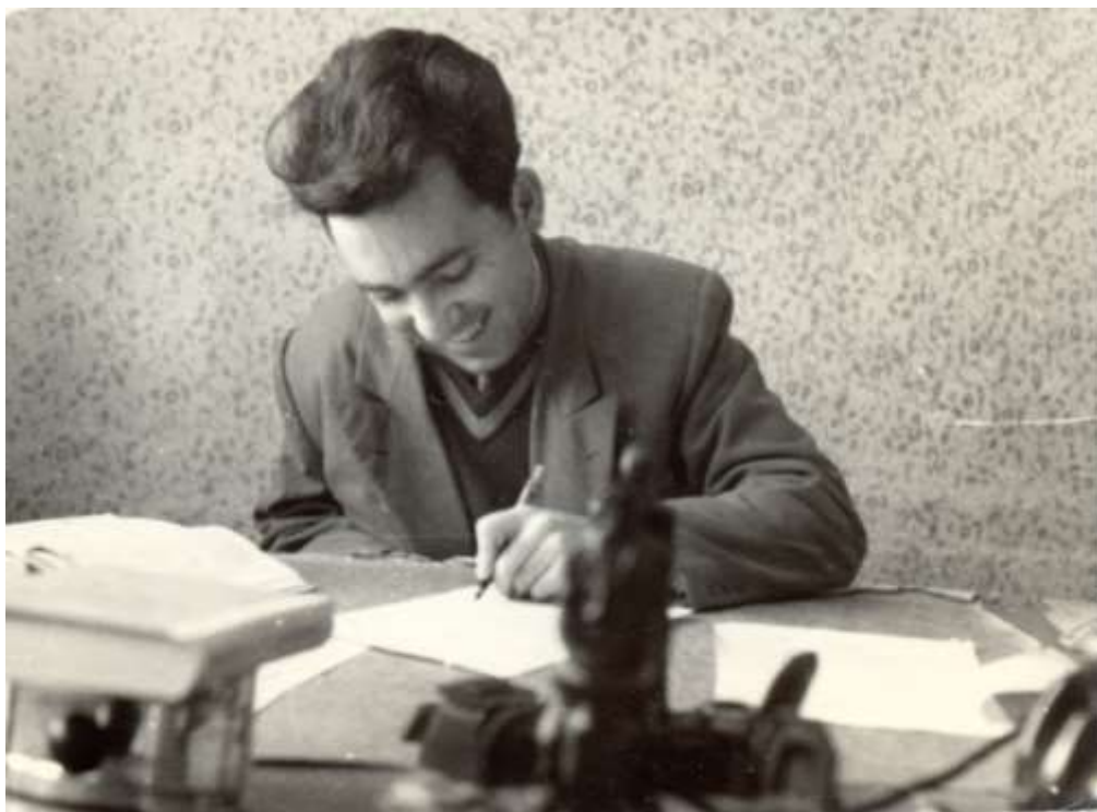
Главен юрисконсулт на ДЗС – Белоградчик, 1961 г.

физически здрав и няколко години работеше по изграждането на хмелови конструкции в Берковска околия и после се пенсионира като му признаха и офицерския трудов стаж.