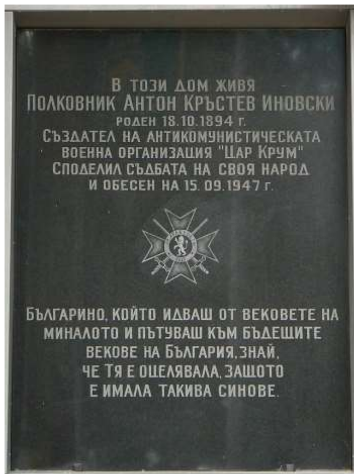
Паметна плоча за подполковник Антон Кръстев Иновски на фасадата на къщата му в София

на свиждане при баща ми в Централния затвор и му носехме дрехи и храна. 8)