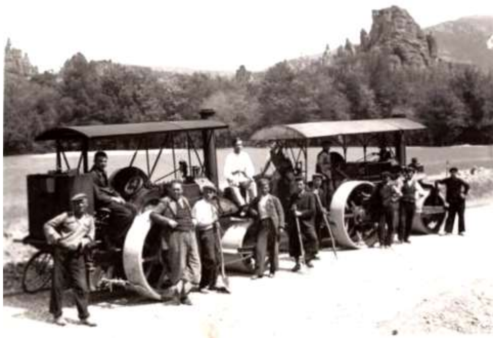
Строителството на новото шосе, 1939 г. 9)