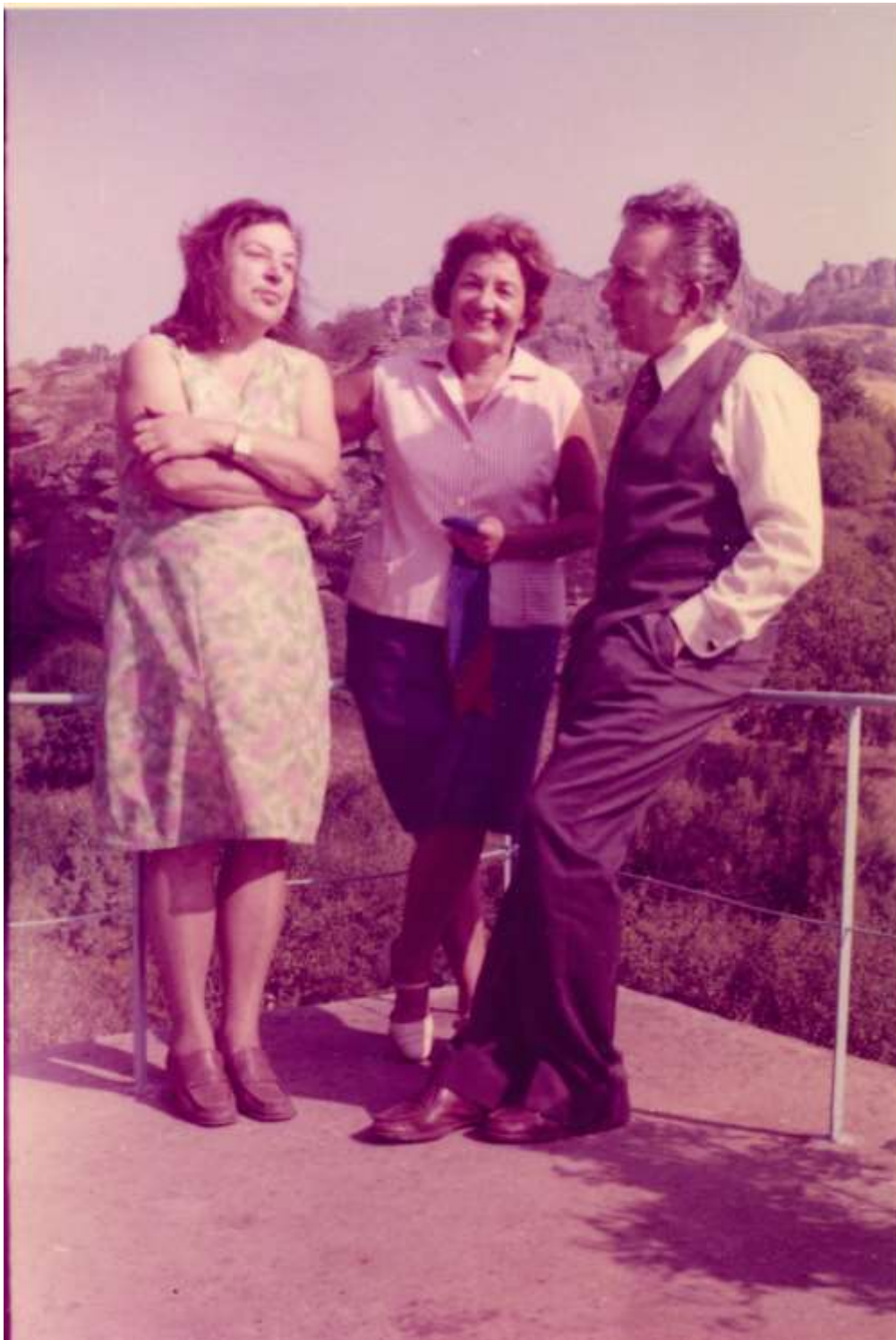
На вилата в Извос, 1975 г.