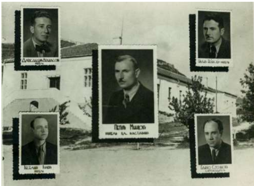
Столарското училище в Белоградчик, 1943 г. 4)