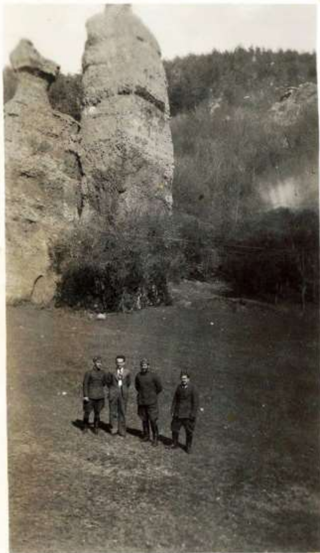
Адам и Ева (снимка: 1941 г.) 2)

оставаш заплепен от елегантната извивка на шосето и цветната мекота на зелените поляни, оградени от най-строги и внушителни скални профили. Не напразно в тая райска долина се намират „Адам“ и „Ева“. Адам е наистина само идея за семеен „стълб“, но Ева, особено в профил, е запазила всичката достоверна внушителност на гъвкавата линия у вечната жена.