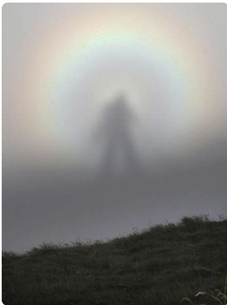
Брокенски призрак 2,3)

преживеят ! Да се обходят всестранно, да се почувства как расте масивната им сила отдолу: сега те не са вече картонени декорации, а могъщи и смазващи растежи от камък. Човек трябва да проникне в плътната им снага между пукнатините и проломите, и да усети напрежението на каменните маси. Да ги отгледа отгоре и да прозре мълчаливо архитектурната им смелост, замайващите наклони и стръмнини, дързостта на еквилибристиката им.