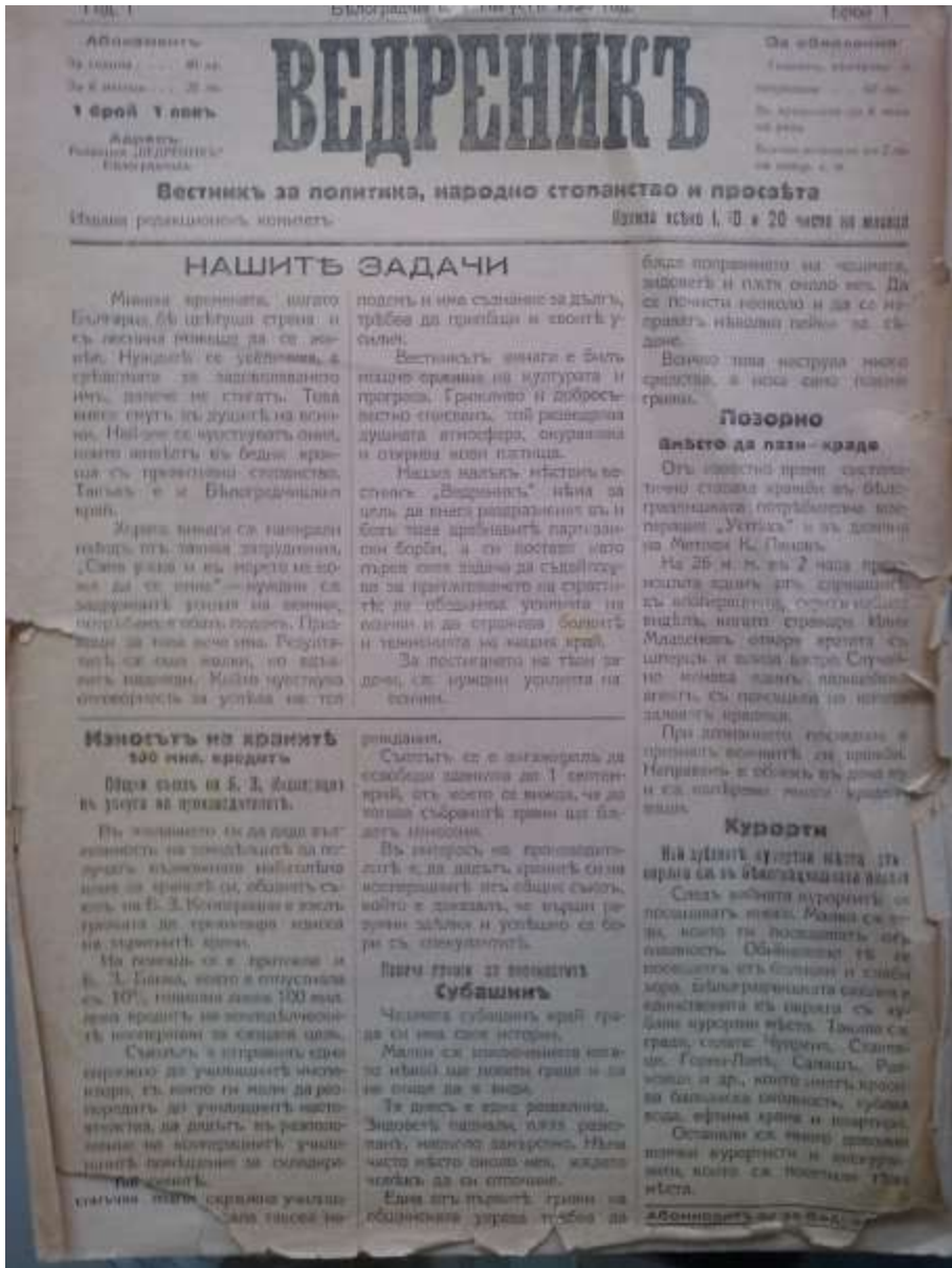
Вестник „Ведреник“, издаван в Белградчик

Чудовищен каменен мит. Сурови и титанични напрежения на каменни масиви. Радвайте им се така и ги боготворете, поглъщайте с очи хипнотичната им скулптура, без да ги „опроличавате“, без да ги правите книжни. Но, ако сте по-романтични, може да ги съзерзавате по своему.