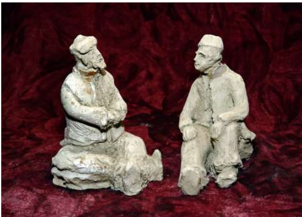
Хитър Петър и Настрадаин Ходжа