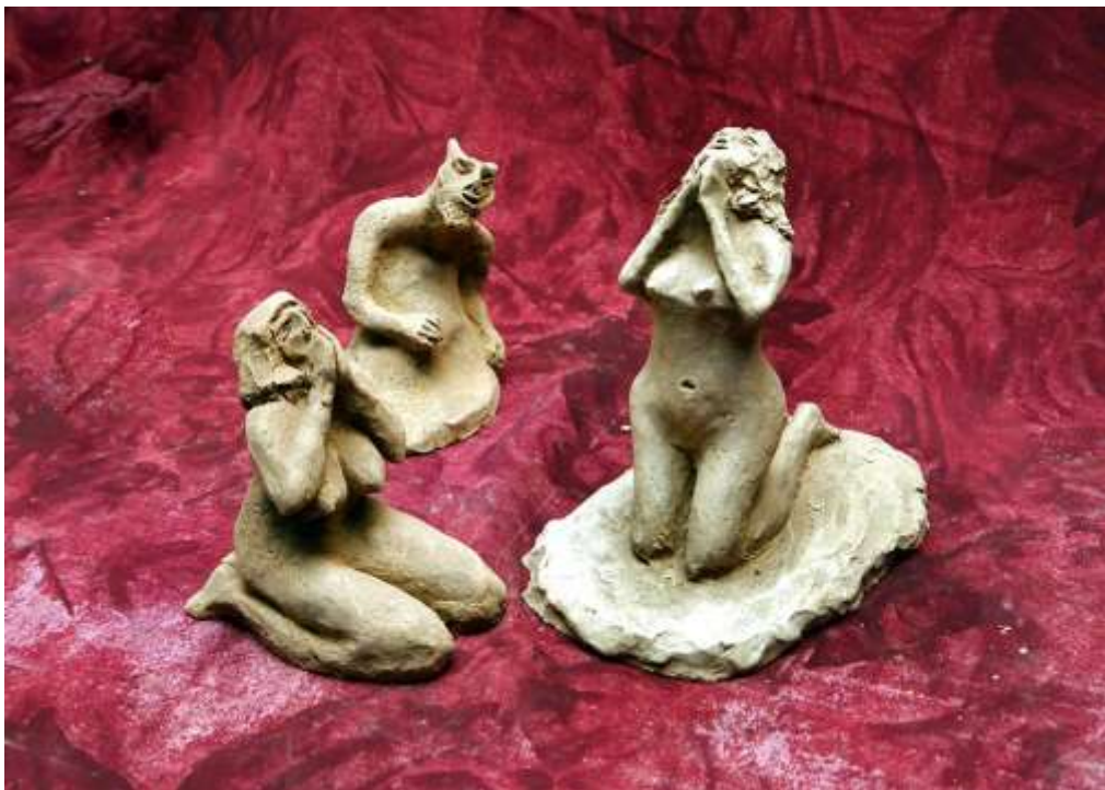
Молитвата на грешниците