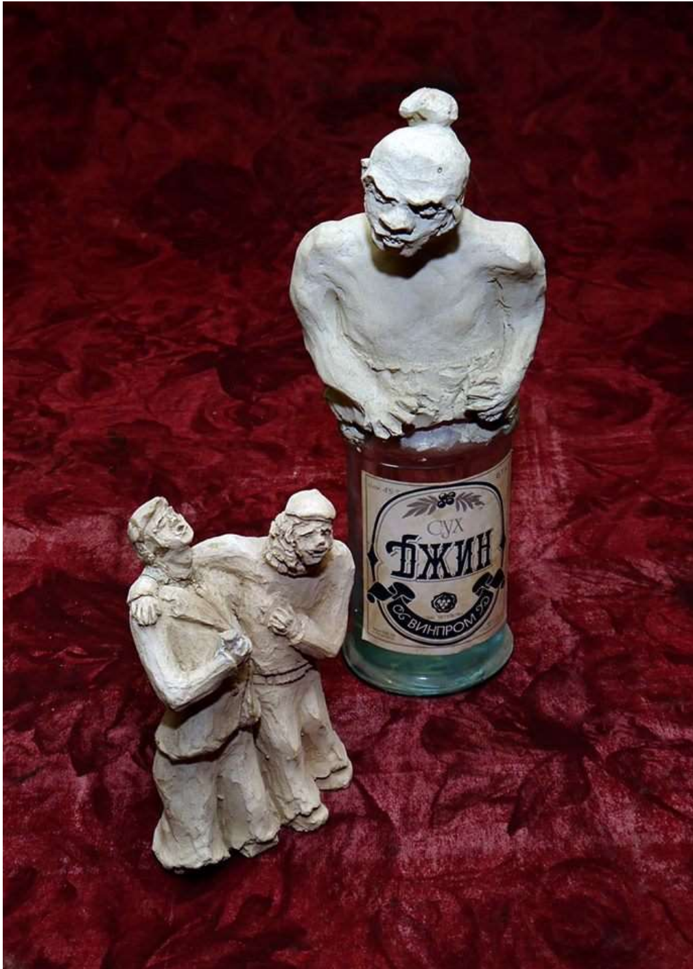
Джин – злият дух на алкохола