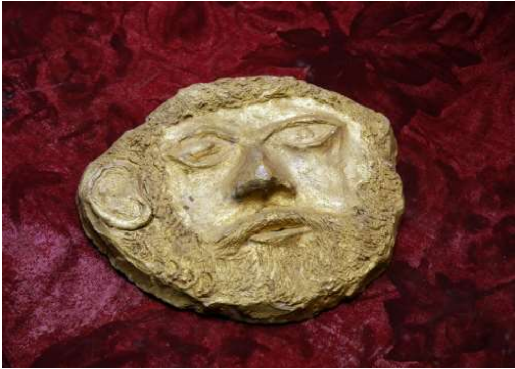
Маската на Терес