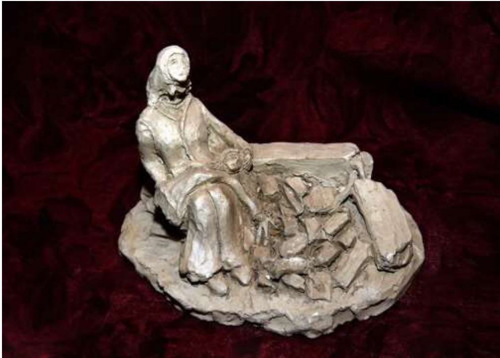
Земестресението в Стражица