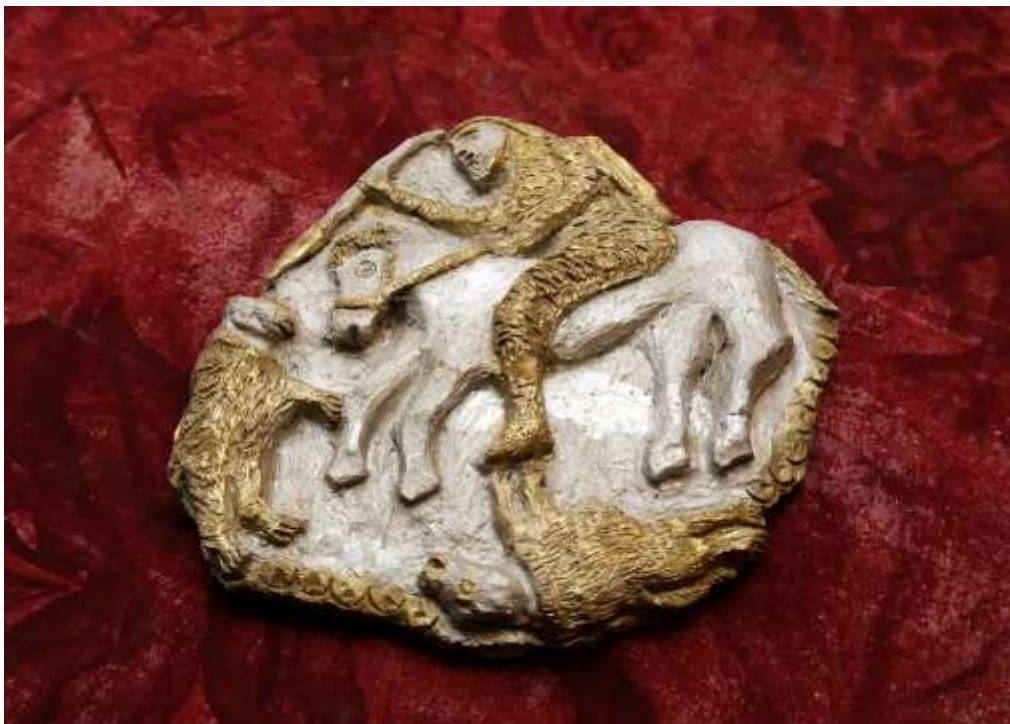
Конник с кнемида (копие от могилата в с. Летница)