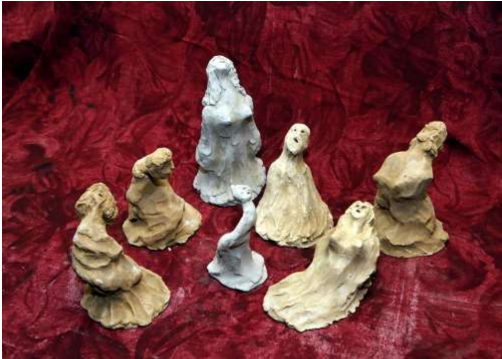
Излизане на духа от тялото