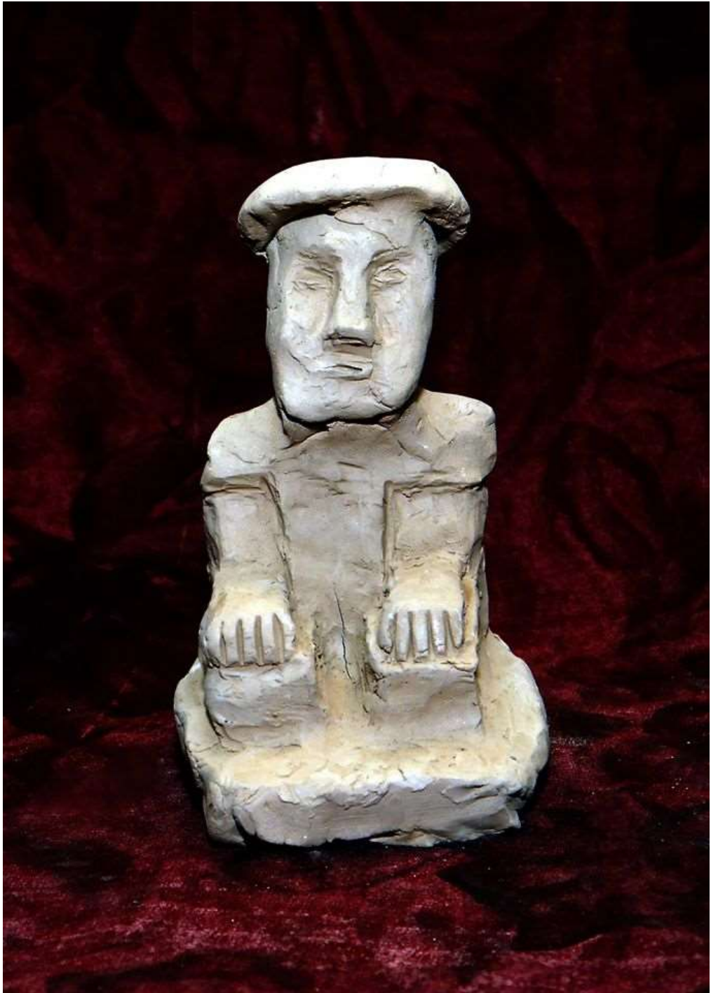
Идол на маите