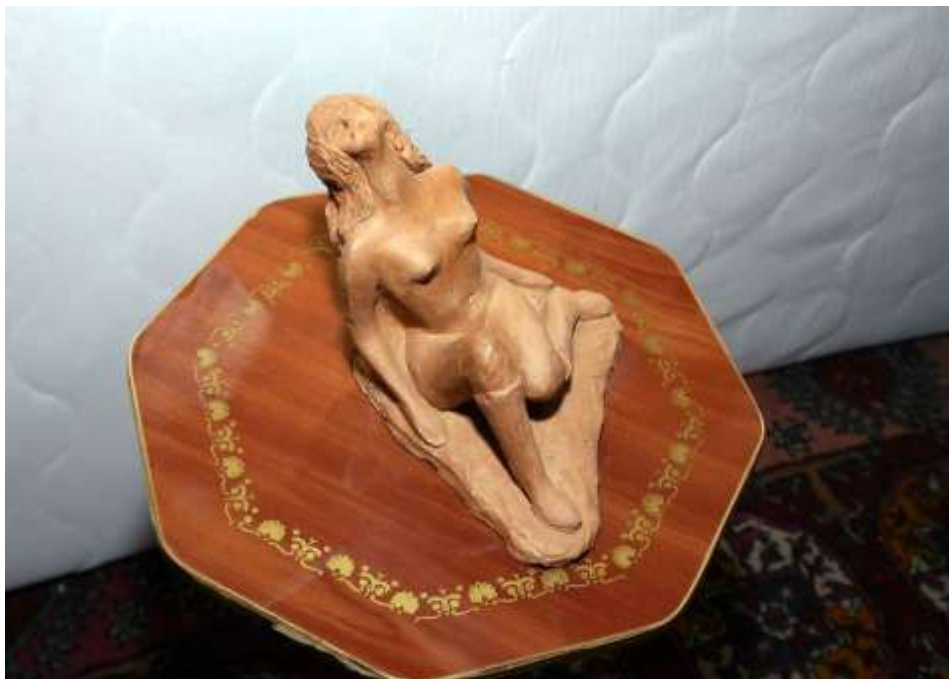
Изоставена, или отчаяние