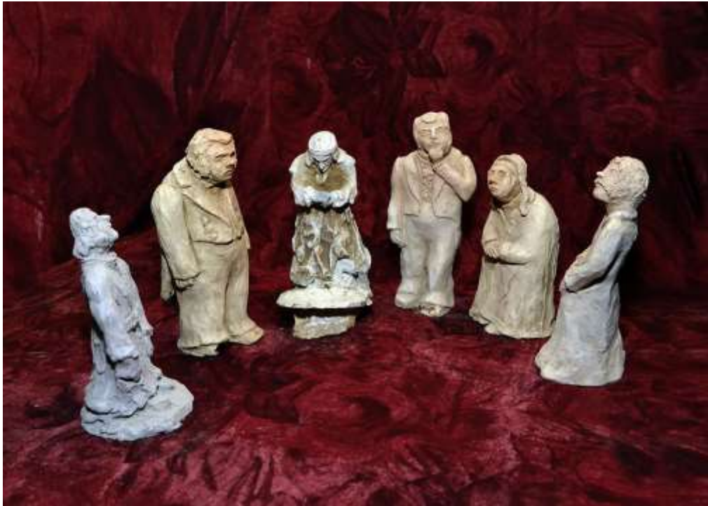
Героите на Гогол