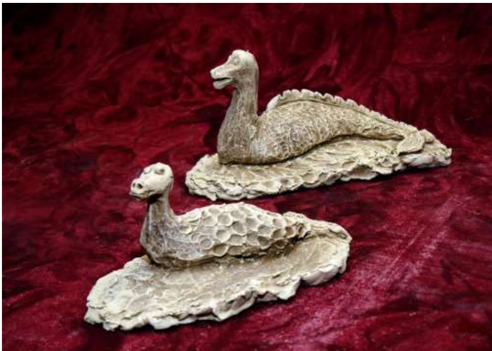
Чудовища от Лох Нес