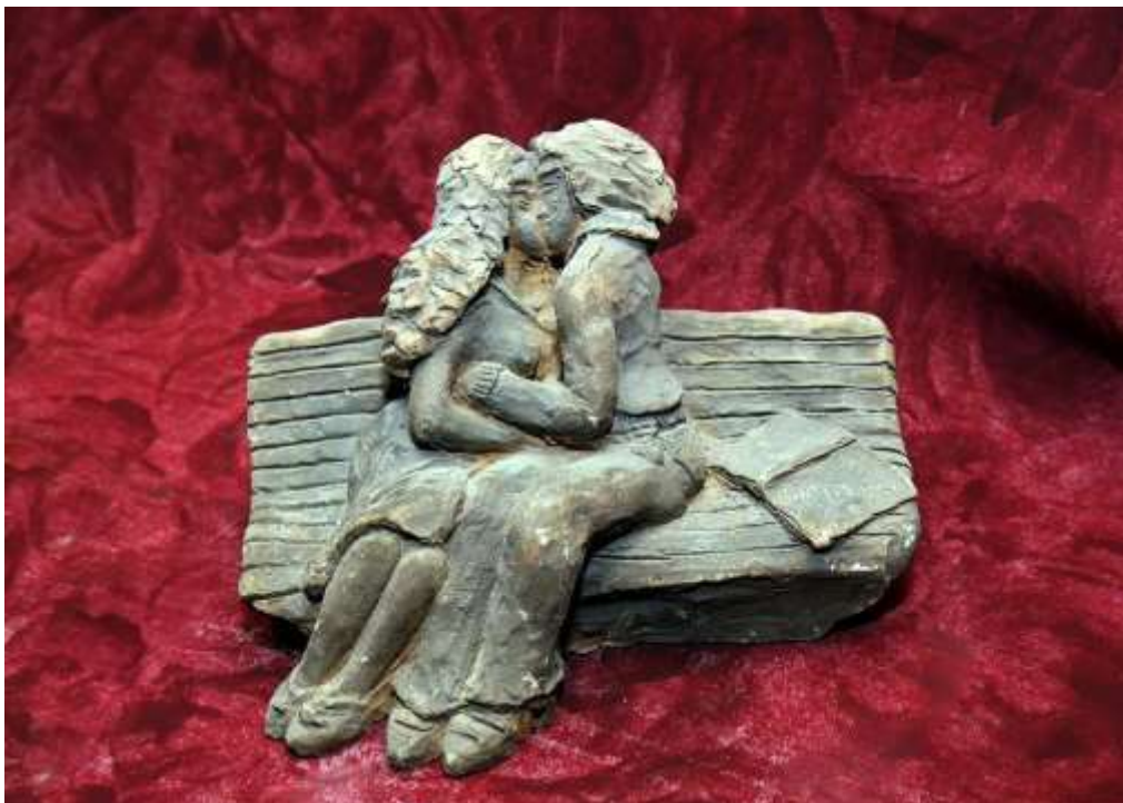
Пред изпита по анатомия