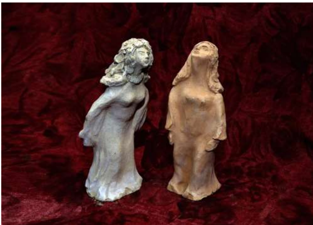
Поглед към звездите