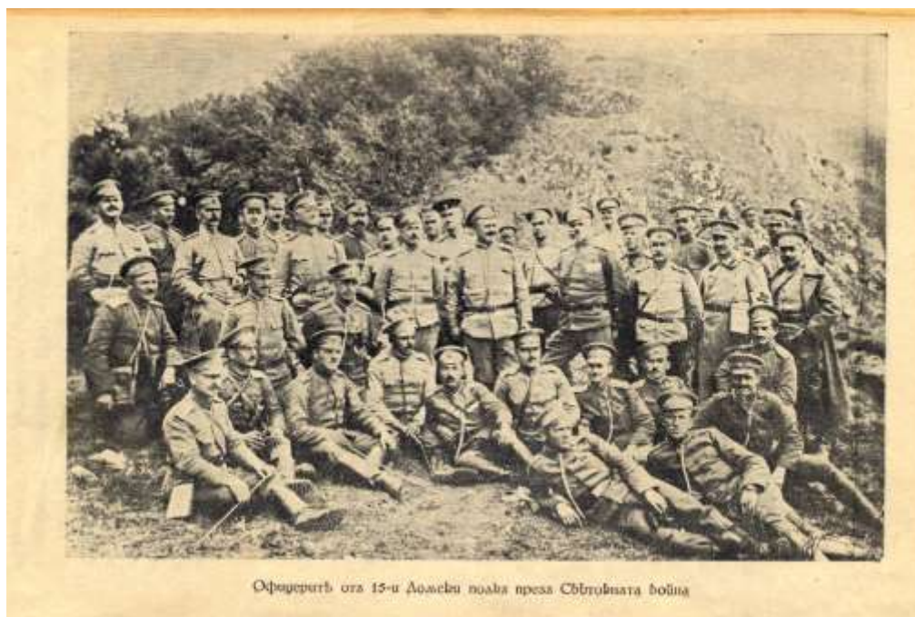
Офицерите от 15-и Домачев полк през Сръбската война