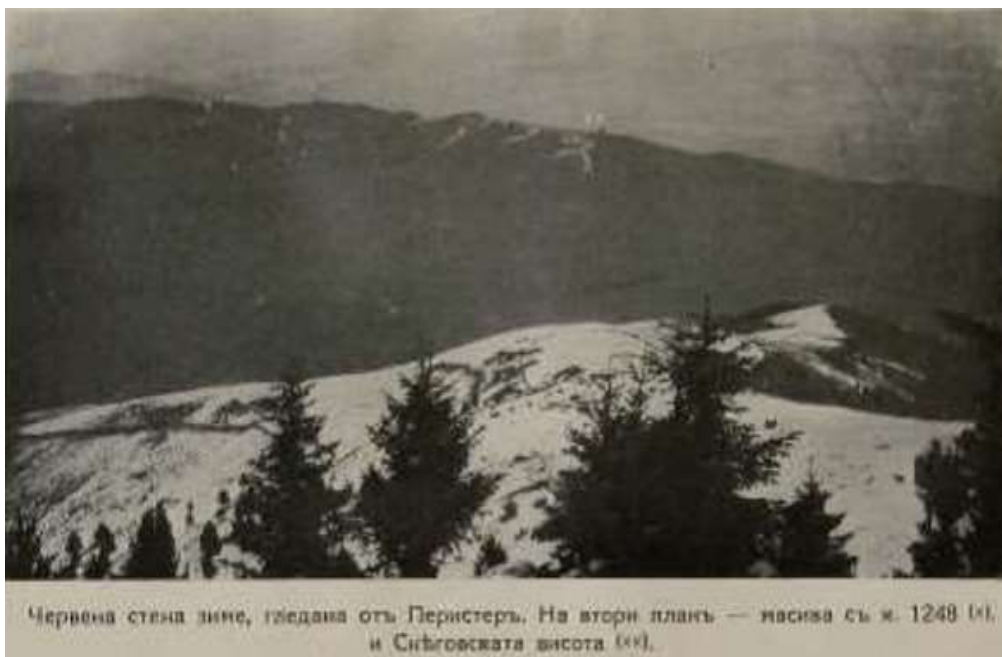
Червена стена зиме, гледана отъ Перистеръ. На втори планъ — височина съ в. 1248 (M), и Сибговската висота (M).

Неприятелските позиции пред центъра на нашия участък отстояха на 700 крачки, а пред Куполната височина – на 200 крачки. По западните склонове на Червената скала се намират селата Магарево и Търнава, в които лятно време битолчани прекарват почивката си. Неприятелската тежка артилерия бе скрита в гънките на малките възвишения в полето и в крайнините на Битоля.