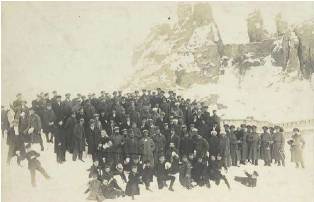
Марковският полк и граждани заедно честват 3 март – Освобождението на България (3 март 1924 г.)