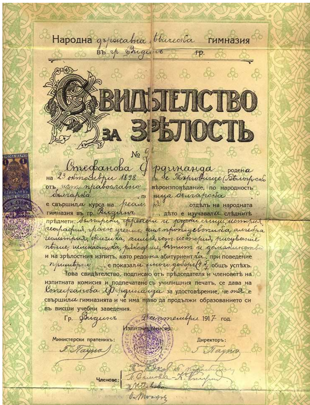
Диплома от Девическата гимназия във Видин (1917 г.)