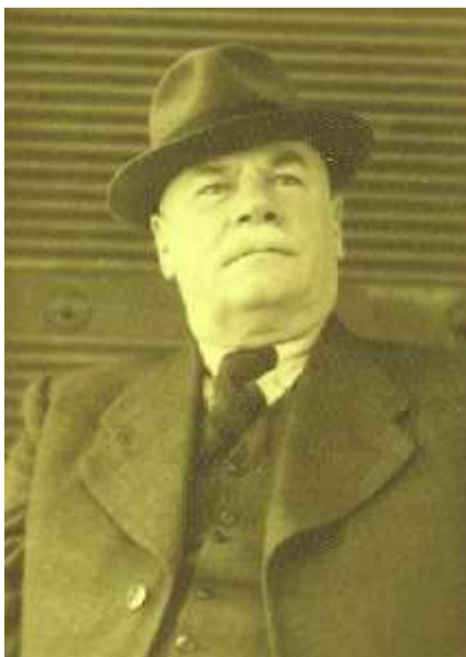
Капелмайстор Димитров