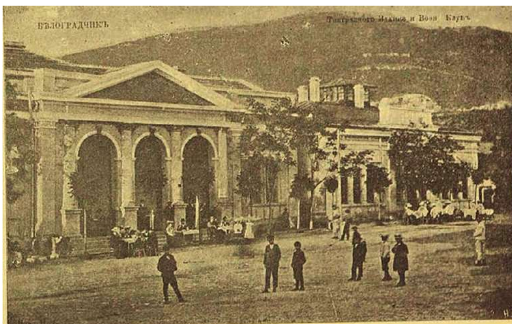
Театър „Пчела“ и Офицерското събрание