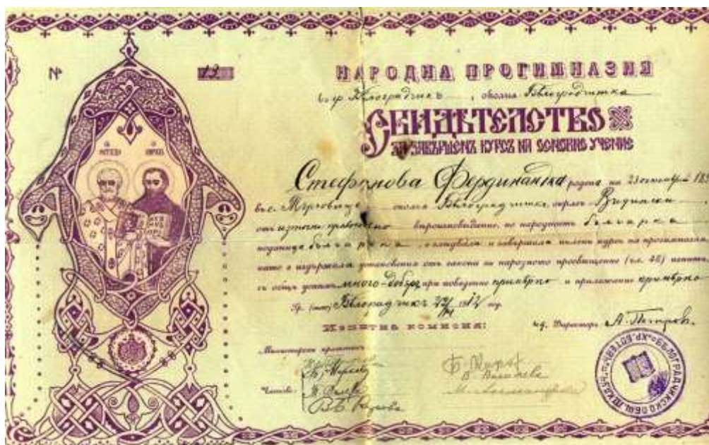
Свидетелство от прогимназията в Белоградчик

готвеха най-хубави яденета и баници, а младежите с маски на главите и оригинални облекла посещаваха къщите на познати и непознати и създаваха весело настроение. Навсякъде бяха добре приети и почерпвани, защото не се знаеше какви хора се криеха под маските. Всичкото ядене каквото останеше от заговезни на следващия ден в понеделник се изхвърляше и започваше “Тудорова неделя”, през която се пазеха строги пости. Не се ядеше не само месо, но дори и олио, и то само по веднъж на ден в 4 часа (следобед), когато удряше камбаната. Подражавайки на старите хора и ние ученичките на обяд не си отивахме в къщи да се храним, а оставахме целия ден в училище да гладуваме, и често пъти от глад на някоя ученичка прилошаваше и припадеше.