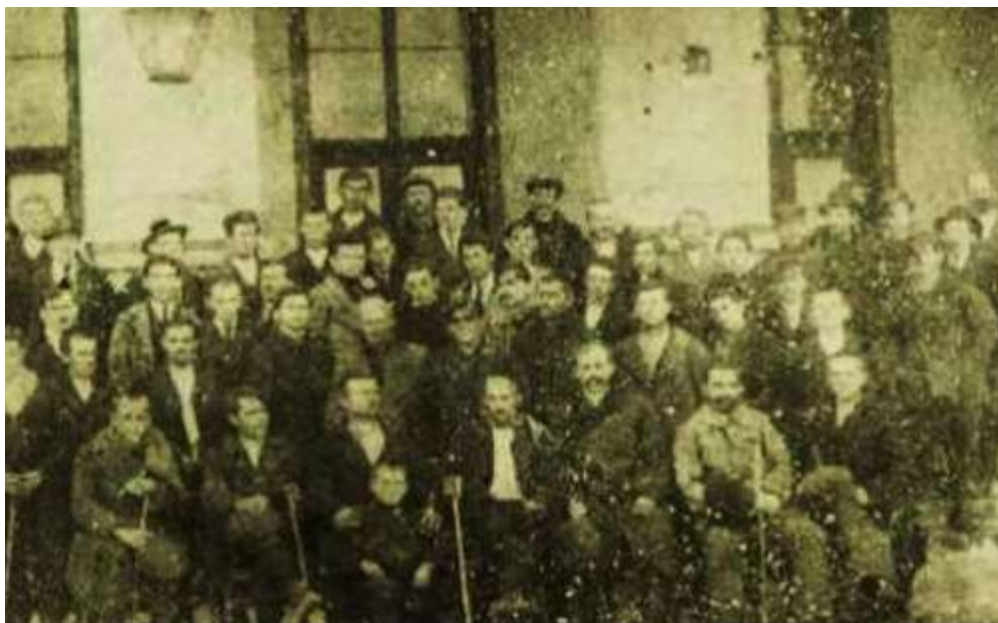
Конференция на комунисти в Белоградчик, 1920 г.