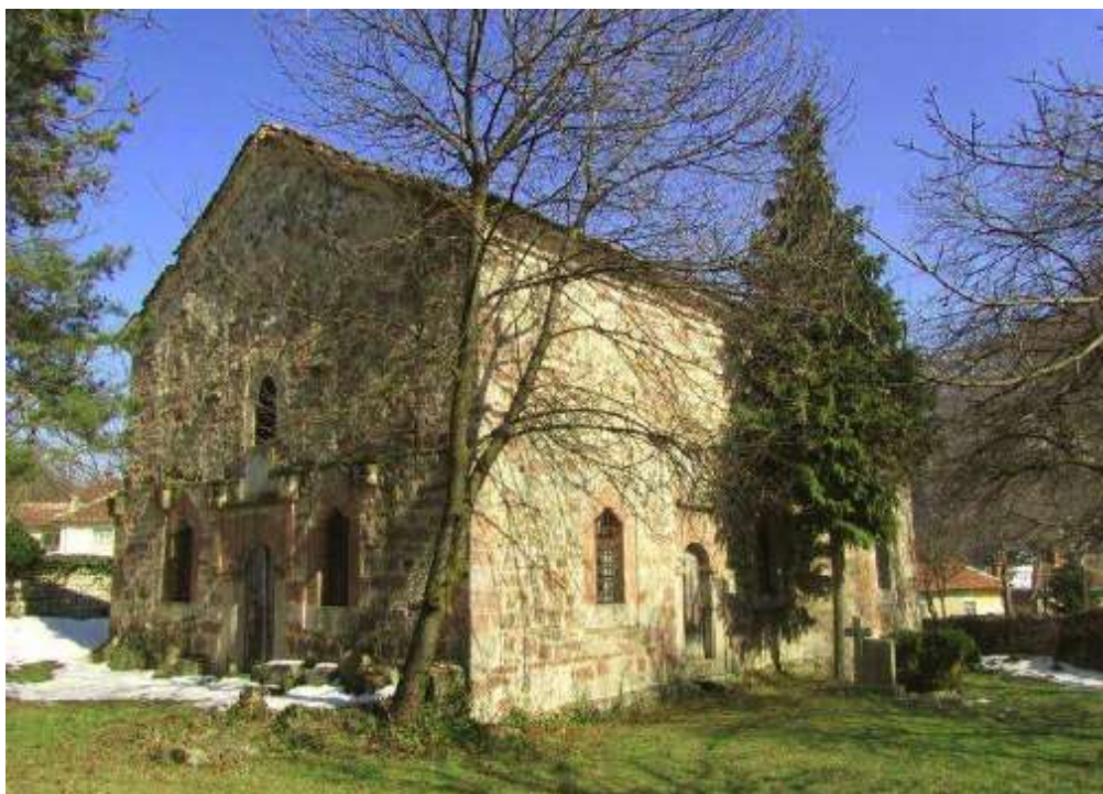
Черквата „Св. Николай“ в с. Търговище

Моето село Търговище е основано по-късно от околните. Неговите първи жители са преселници от Македония. Съседното село Репляна е много по-старо. Жителите му коренно се различаваха по говор, облекло и обичаи от жителите на околните села. Те говореха напевно. Наричаха ги “латинци”; самото име на селото вероятно е латинско - Реплана.