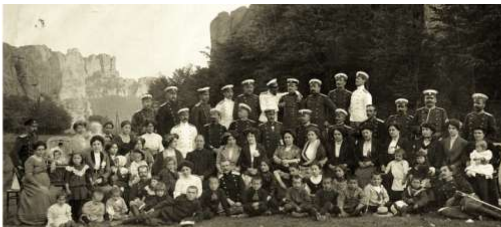
Офицерите на 15-и пехотен Ломски полк и техните семейства, 1910 г.

“Мислен камък”, но и тук посетителите бяха нагрufenите офицерски дами и жените на по-заможното съсловие, а беднотията, срамувайки се от скромното си облекло, се качваше по скалите и от там слушаше музиката. Военната музика допринесе много за музикалното възпитание на белоградчичани. Слушала съм занаятчии с уста да свирят правилно различни арии от класически опери.