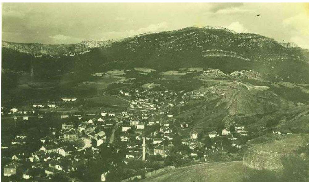
Белоградчик в началото на XX век

И сред тази красива природа е сгушено градчето с около две хиляди жители, малка част от които са турци и цигани. От южната страна се намира старинната крепост Калето, а в подножието му е островърхата джамия с минарето. От северната страна на града са разположени пет-шест дълги казарми, в които се помещаваше 15-ти пехотен Ломски полк. Всяка вечер ходжата изпяваше от минарето своята вечерна молитва, след