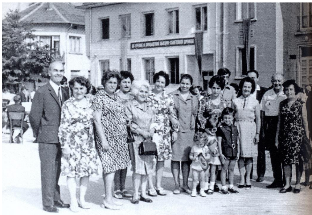
Фамилна снимка в Белградчик, 1980 г.