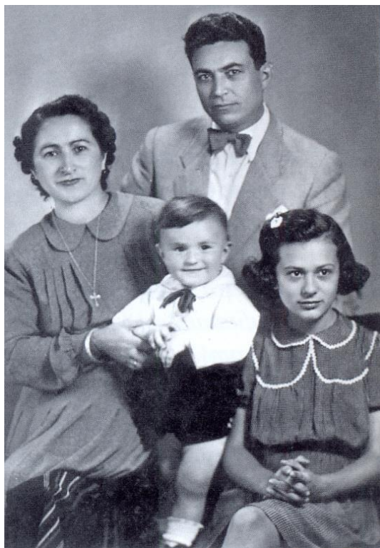
Семейна снимка от 1945 г.