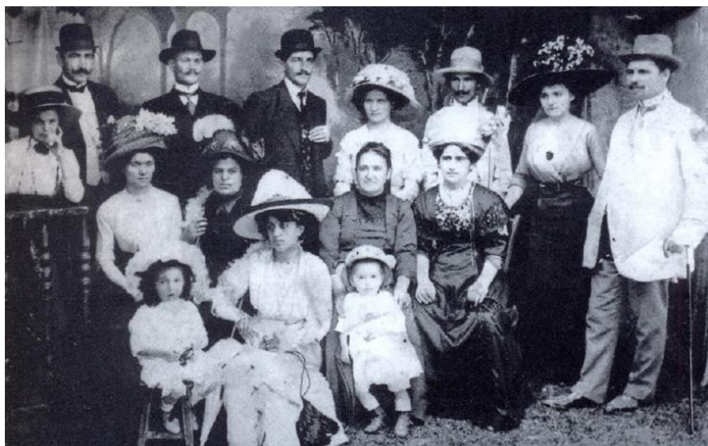
В Белоградчик, около 1913 г.