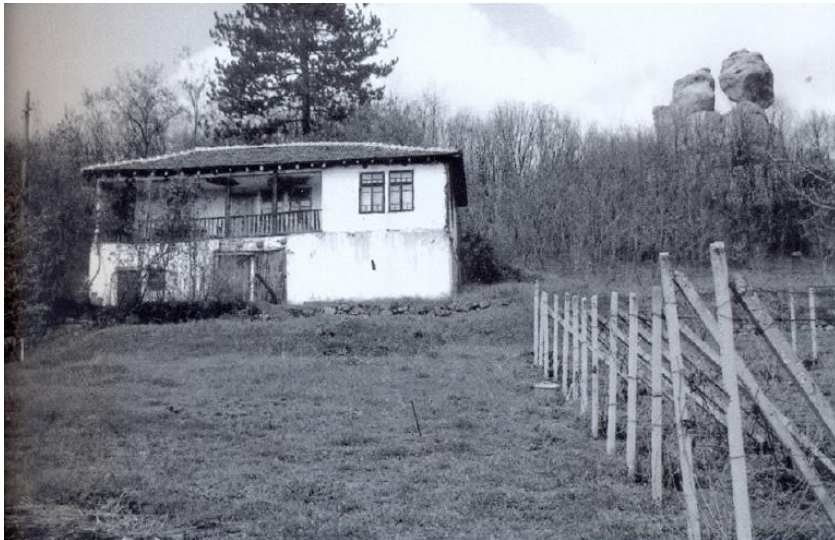
Старата къща на Цеко Главчев в Маркашница

А Баграна Попвасилева е родена в Белоградчик на 29 юни 1932 г. Тя е завършила френска филология в Софийския университет и е специализирала в Парижкия университет, от където е нехната дисертация “Le theatre de Giraudoux” (1969) (Belanger, 1978).