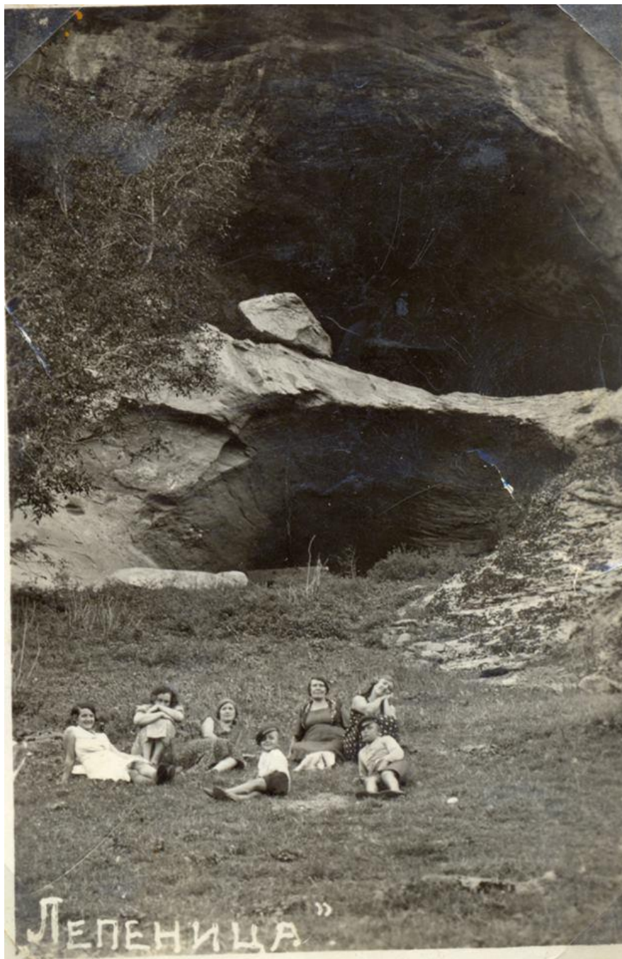
На разходка до Лепеница, около 1930 г.