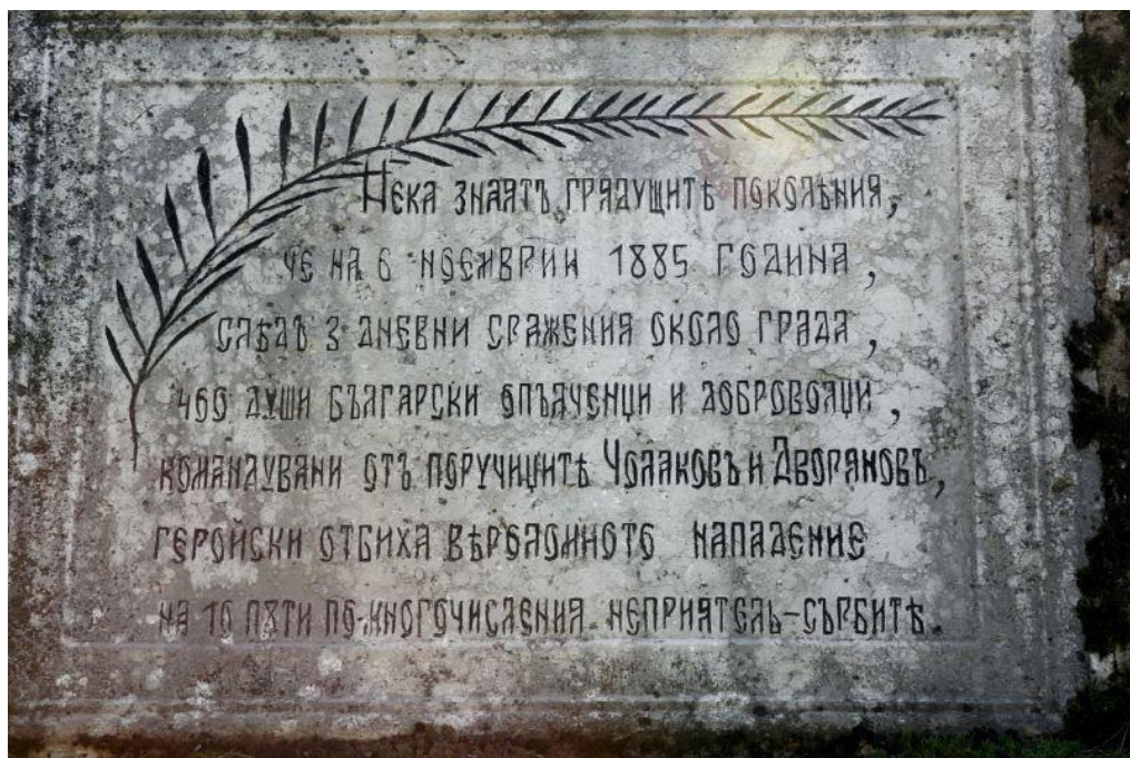
Паметната плоча на входа на града