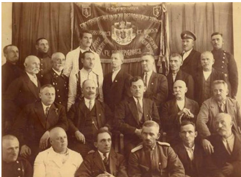
Настоятелството на Белоградчишкото благотворително запасно подофицерско дружество „Полковник Стефан Илиев“ пред знамето на дружеството, осветено на 7 април 1929 г.

Възпоменателните медали за участие във войните за национално освобождение и обединение, носени в тържествени моменти, са били повод за заслужена гордост за притежателите им. Вероятно те са изпитвали смесени чувства – удовлетворение за достойно изпълнен дълг към Отечеството, скръб за загиналите приятели и близки и може би гняв за неосъществения национален идеал и мъка по съсипания тежък живот в следвоенните години.