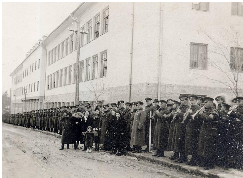
Прощаване с командира - полк. Христо Гагов напуска Белоградчик

Александрово, Белоградчишко, заявява по един медал за войните 1912 – 1913 г. и войната 1915 – 1918 г.