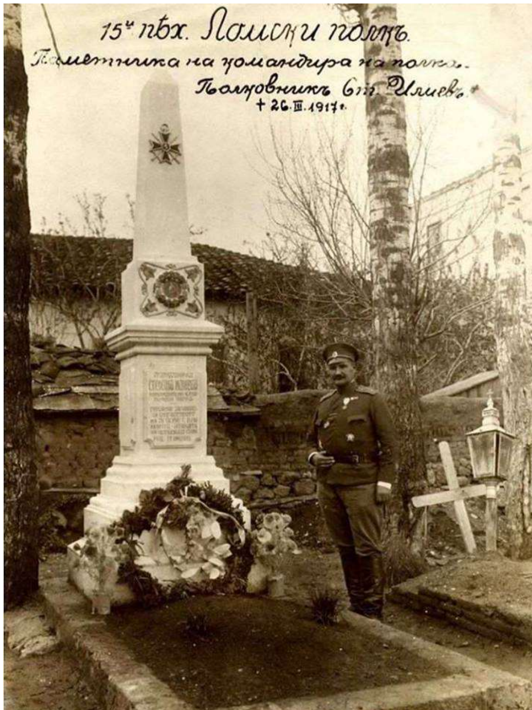
Паметникът на полк. Стефан Илиев в гр. Прилеп