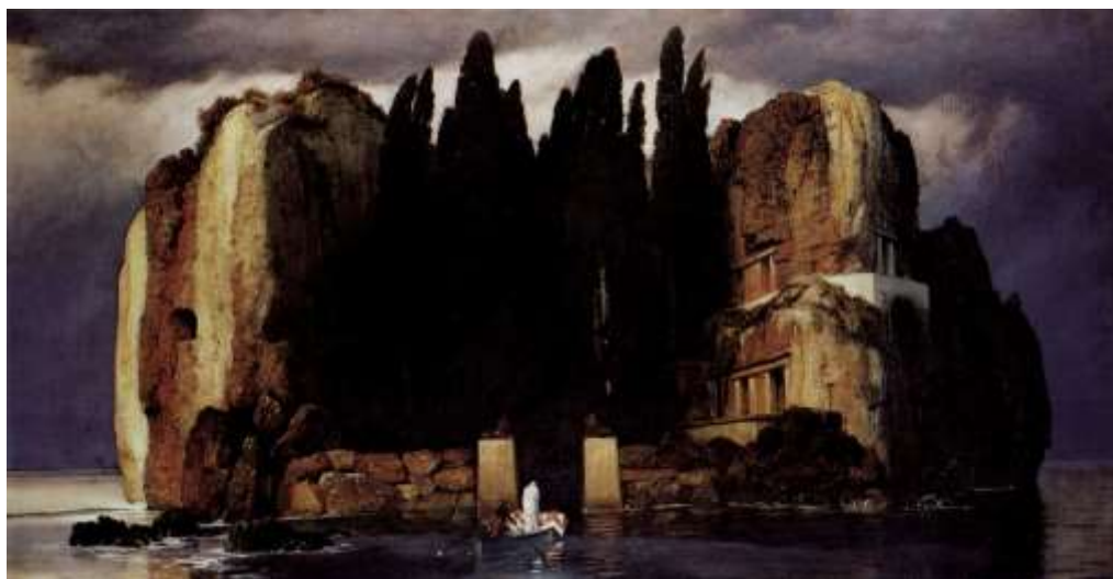
Die Toteninsel (1886), Arnold Böcklin (1827-1901)

тук, за да видите нехния реален образ, бих казал за да видите от къде е черпил сюжета си Бьоклин. Този остров с много по-тайнствена сюзировка е непосредствено над дефилето в дясно. Скалите са заградили една полянка. Същите стърчат отстрани като сводове и зидове на старинен замък. И това в цялостна картина дава пълната идея на изострената фантазия за „Острова на мъртвите“.