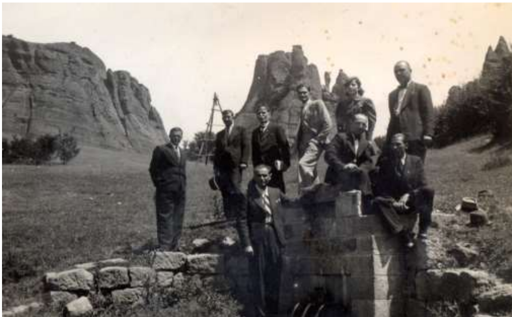
Долня, 1940 г.