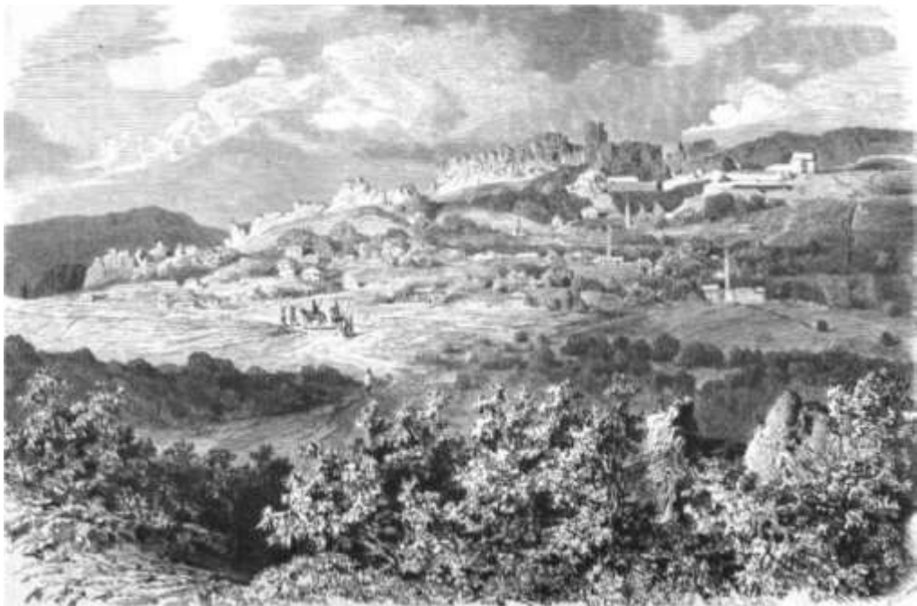
Феликс Каниц, 1876 г.

Имало и трета джамия – теке с викало, която се е намирала в двора на Околийския съд. Но, ако погледнете приложената тук много рядка и непозната в България гравюра на Каниц, може да видите повече от три джамии в Белоградчик.