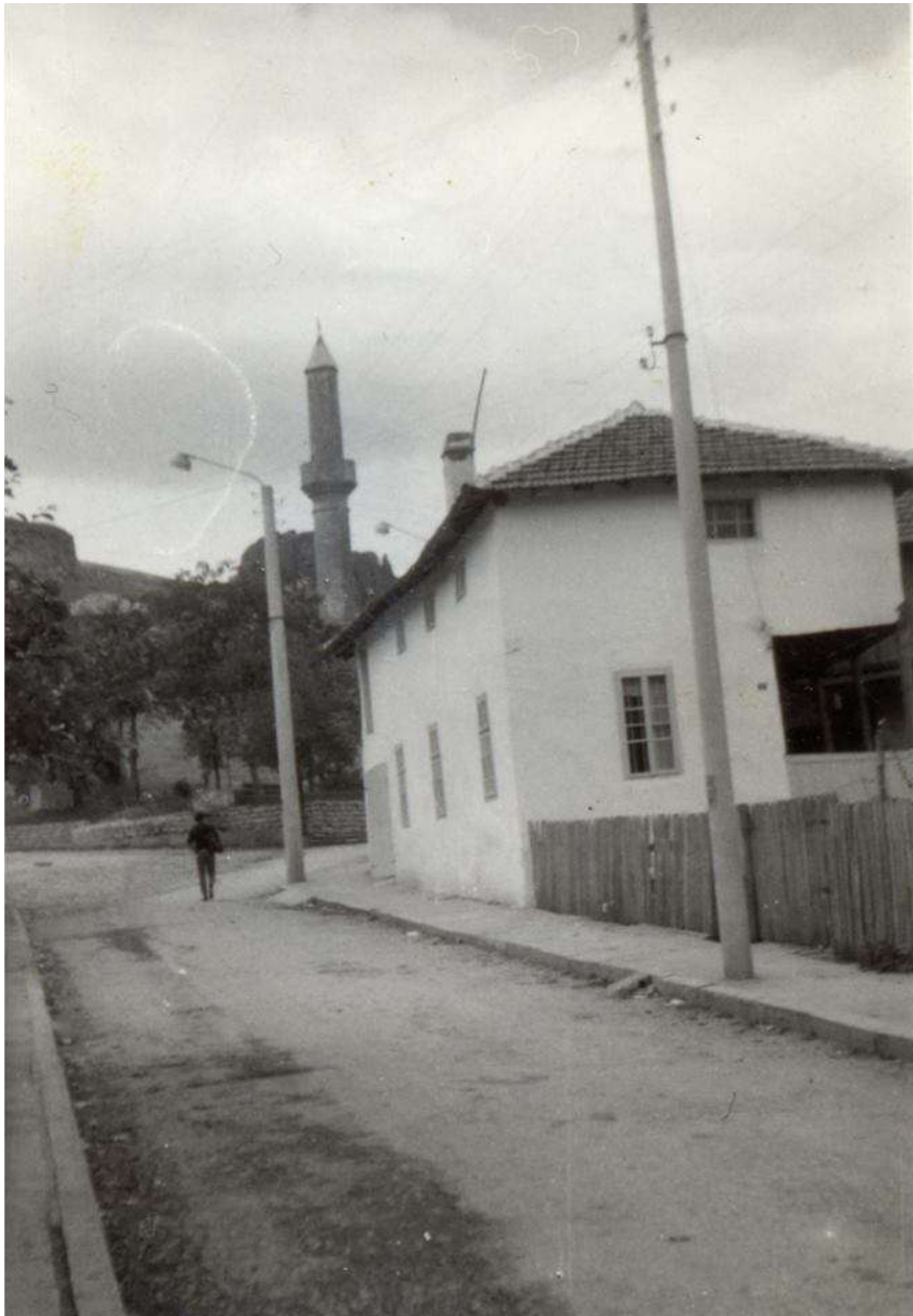
Джамията Х. Хюсеин (1970 г.)

В съседство е била и джамията Х. Мехмед. Тези джамии са построени от братята Насі Husseyin Aga и Насі Mehmed Aga и имотите на тези джамии са се простирали към Планиница и чак до Боровица – получени с берат на Осман Пазвантоглу тези имоти са били тяхно притежание в дълъг период от време.