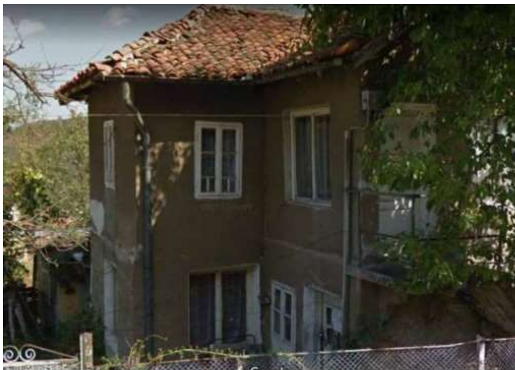
Къщата на Бугарите, сега

От прозореца на стаята гледах към улицата – тя там се разширяваше и беше нещо като площад – по това време там бяха поставили един голям кръгъл високоговорител, който озвучаваше целия квартал. Такива високоговорители имаше точно три – един този и другите пред съда и на центалния площад на място, сега заето от шадравана. На площада пред високоговорителя винаги се събираха младежи да слушат мачове, а когато мачовете не се предаваха, тази група отиваше в старата поща с молба телефонистките да проверят какъв е резултата от мача.