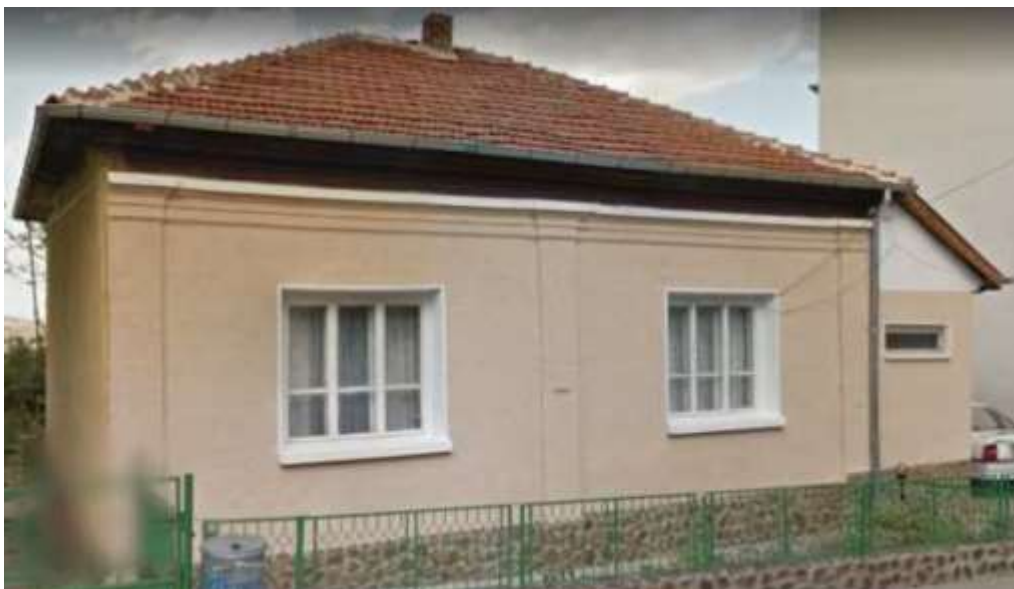
Домът на Трифон Савчев