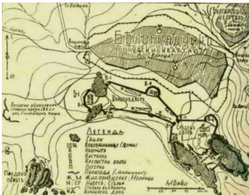
План на Белоградчик, 1865 г, (Ванков, 1946)