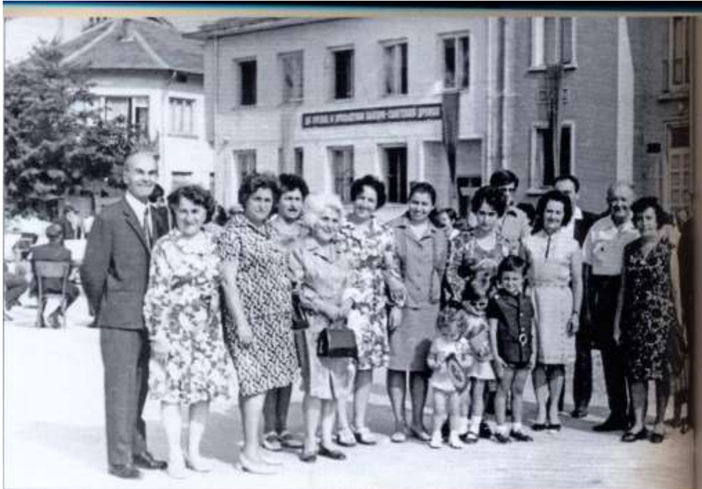
„Една от последните фамилни снимки