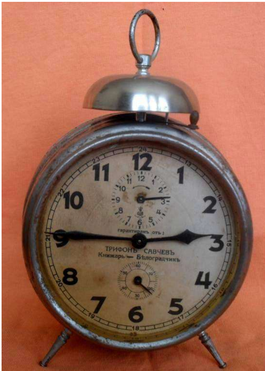
Часовник от книжарницата на Трифон Савчев