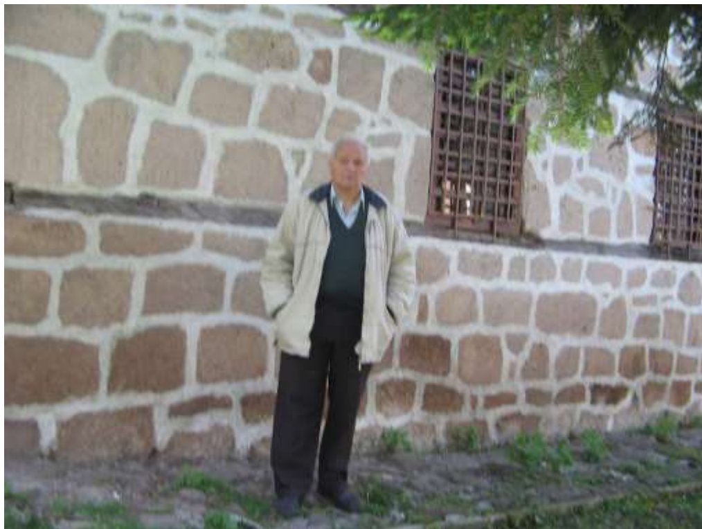
Пред джамията, 2009 г.

В късно време джамията бе почнала да се руши – бе паднала от минарето една плоча. Тогава бе направен ремонт на джамията, който засегна само външната ѝ част.