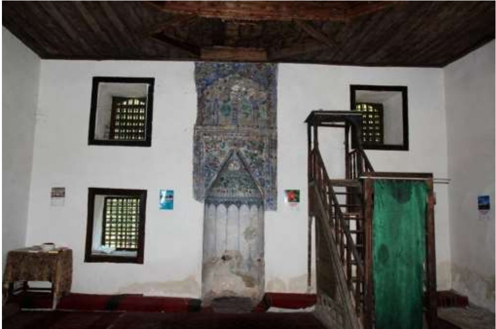
Вътрешността на джамията