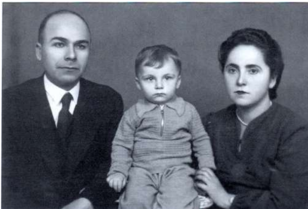
Семейна снимка от 1942 г.

късно време го накараха да напусне София и да започне някаква работа на гарата).