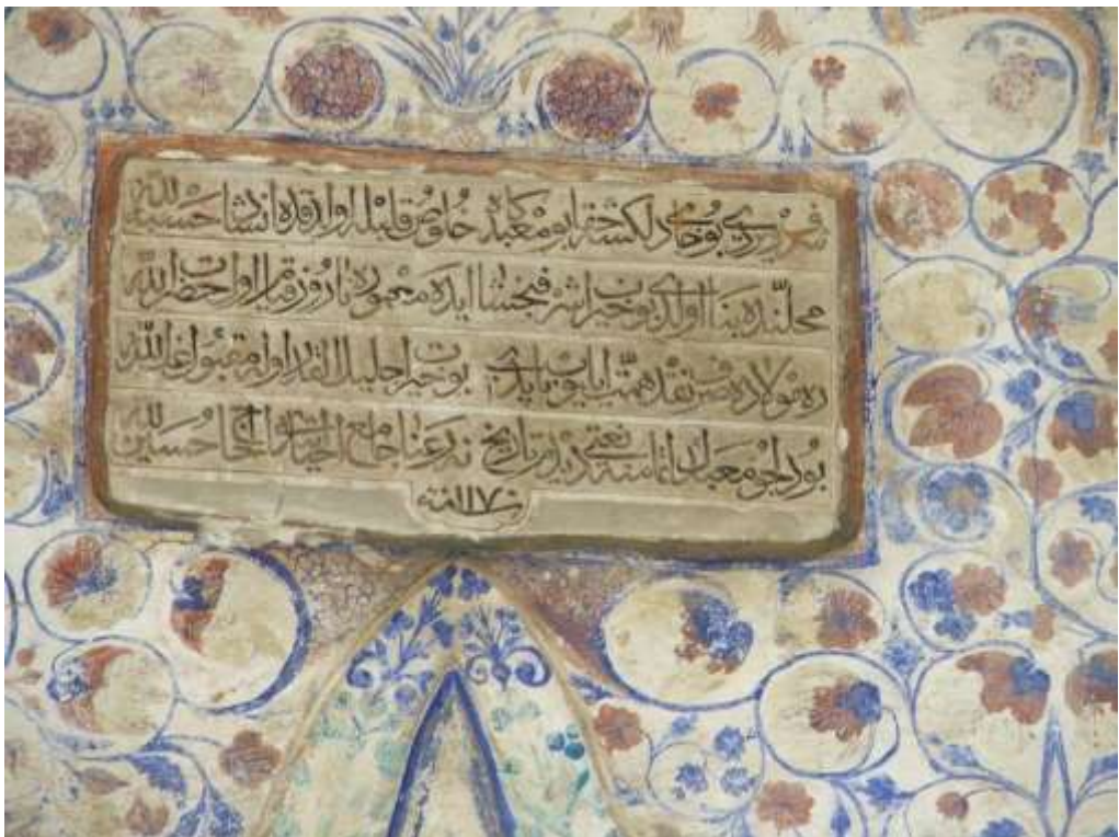
Надписът на входа на джамията