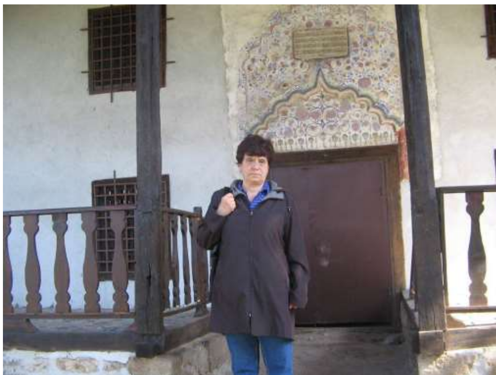
Пред джамията, 2009 г.

Киро Панов: „Войводеният конак“ беше в двора на сегашната прогимназия „Христо Ботев“ – двуетажно здание, направено от дялан камък (долният етаж) и долма (горният етаж) с богата резбарска украса по таваните и долапите, което здание личеше, че в строено преди повече от 1 – 2 века. Това здание изгоря по време на Сръбско-българската война“ (Панов, 2010).