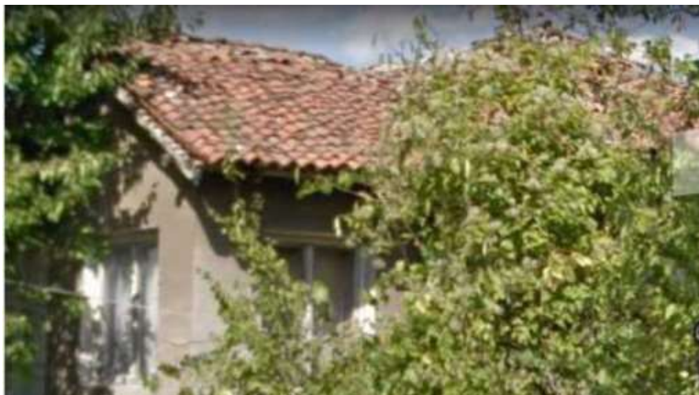
Къщата на Бугарите, сега