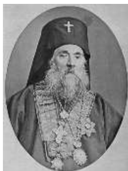
АНТИМ I (1816-1888)

Белоградчишкото Архиерейско Наместничество е открито през 1882 г., когато Видински митрополит е бил Негово Блаженство Антим I, Екзарх Български, починал през 1888 г.