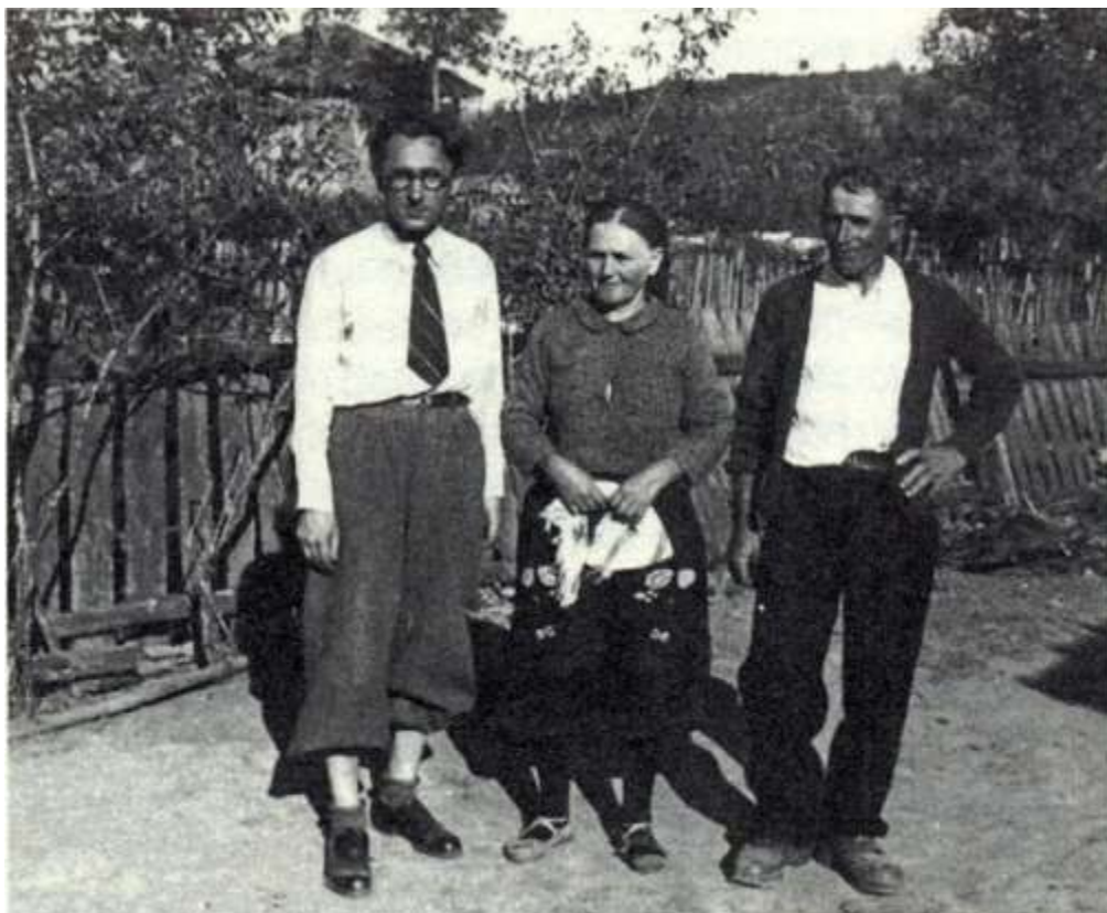
В с. Скомля, Белоградчишко