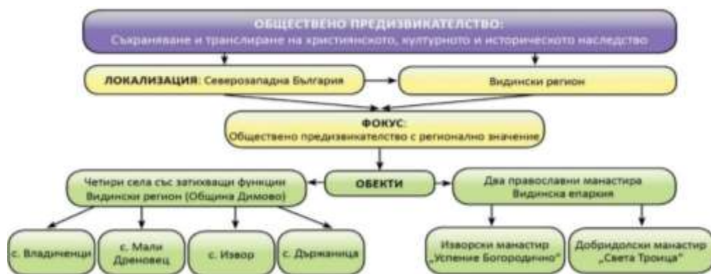
Фигура 2. Локализация, фокус и обект на изследване

За изпълнението на целите на проекта са подбрани четири села във Видински регион, община Димово: с. Владиченци, с. Мали Дреновец, с. Държаница и с. Извор и два действащи православни манастира във Видинска епархия – Добридолски манастир „Света Троица“ и Изворски манастир „Успение Богородично“. Подборът се базира на няколко показателя от практически и научен характер: сходни типологични характеристики на села със затихващи функции, в които белезите на идентичност, духовност и култура са ярко изразени, но и застрашени; недостатъчно добре изследвани богословски, исторически, етноложки и археологически аспекти; предварителен (частичен) теоретичен и практико-приложен опит на местните държавни и общински институции в избраните обекти.