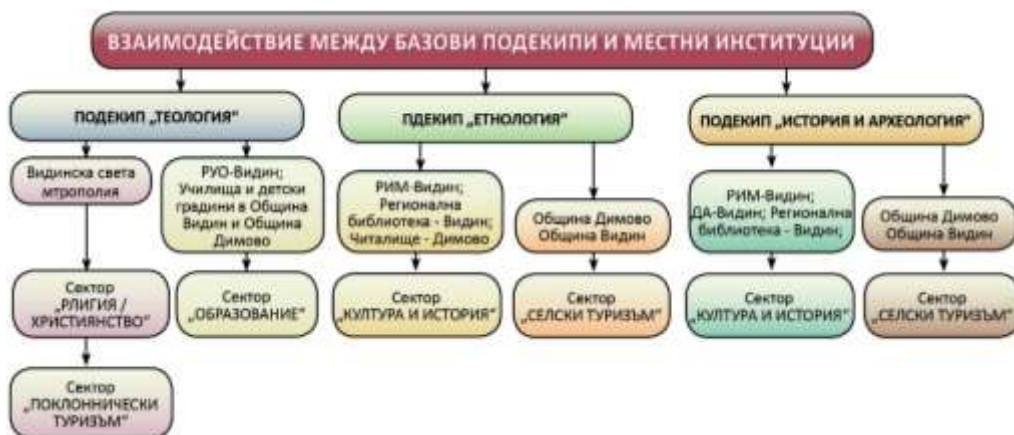
Фигура 1. Условно взаимодействие между базови подекипи и местни институции

Мотивите за надграждането на приключилия проект в настоящия са инспирирани от: (1) един от общите обекти на изследване (с. Владиченци); (2) предварителният опит, постигнати резултати, и установени работни контакти между местни държавни и общински структури и научни специалисти от базовата организация; (3) научният потенциал на базовата организация, който от направление „Религия и теология“ разширява изследователското поле в интердисциплинарен план; (4) възможността за включване и на други обекти със сходни типологични характеристики; (5) изграждането на интердисциплинарна мрежа за приложението на иновационни практики на местно ниво; (6) възможността за привличането на по-голям брой местни специалисти.