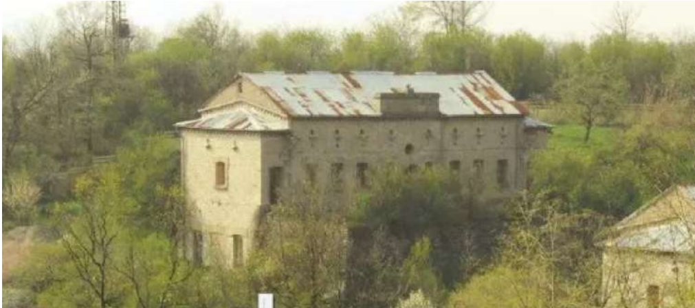
Погребите в Белоградчик