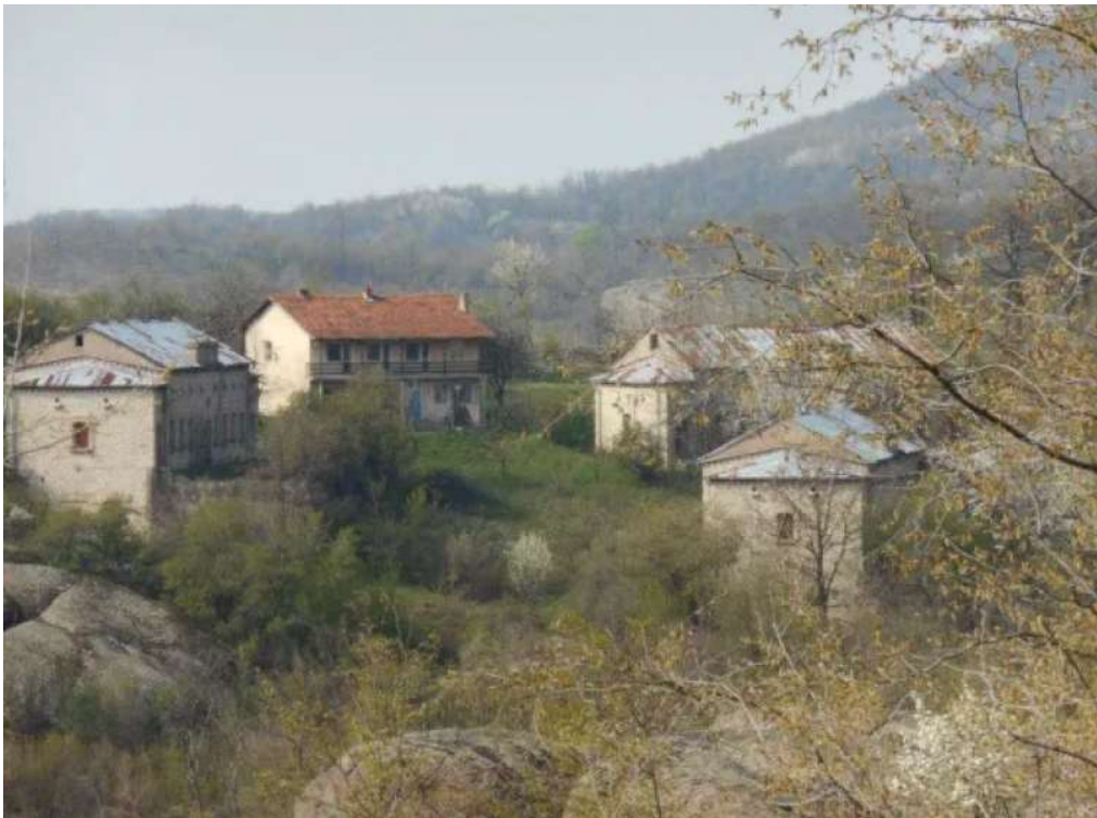
Погребите в Белоградчик