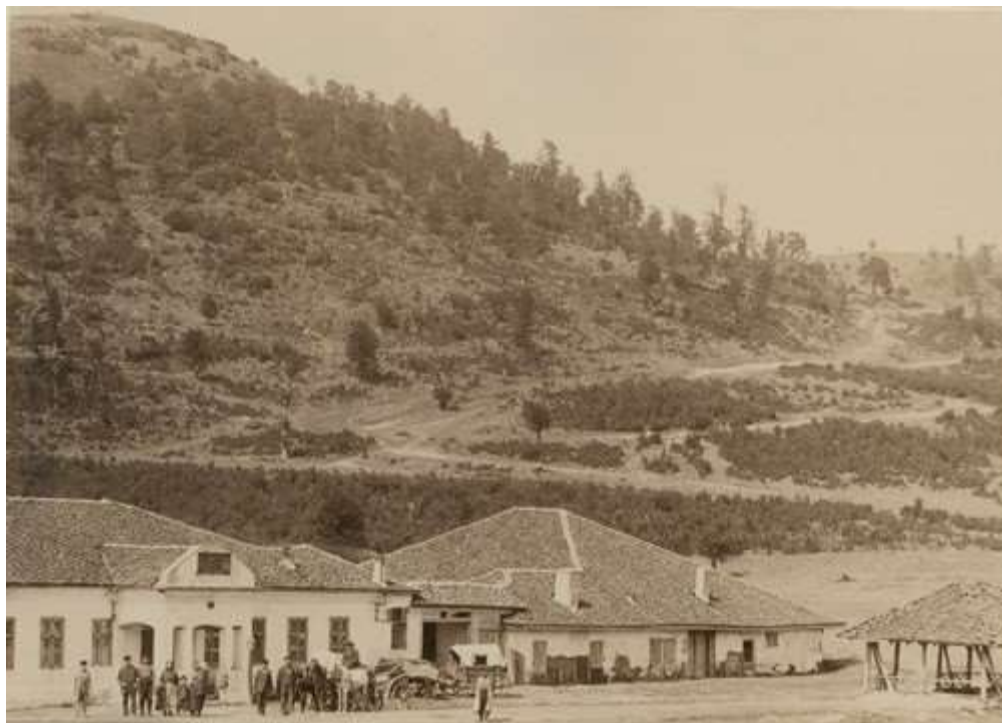
Телеграфопощенската станция на Петрохан

достигнат лютината на Московската зима, бурите забеснѣват по целия шир на планината и почват са подигат замръзналия сняг на облаци към небето. Тогава движението през прохода и през пролуките на планината престава, потоците се сковават в ледове, а горските зверове се скриват в дупките си – изплашени и гладни.