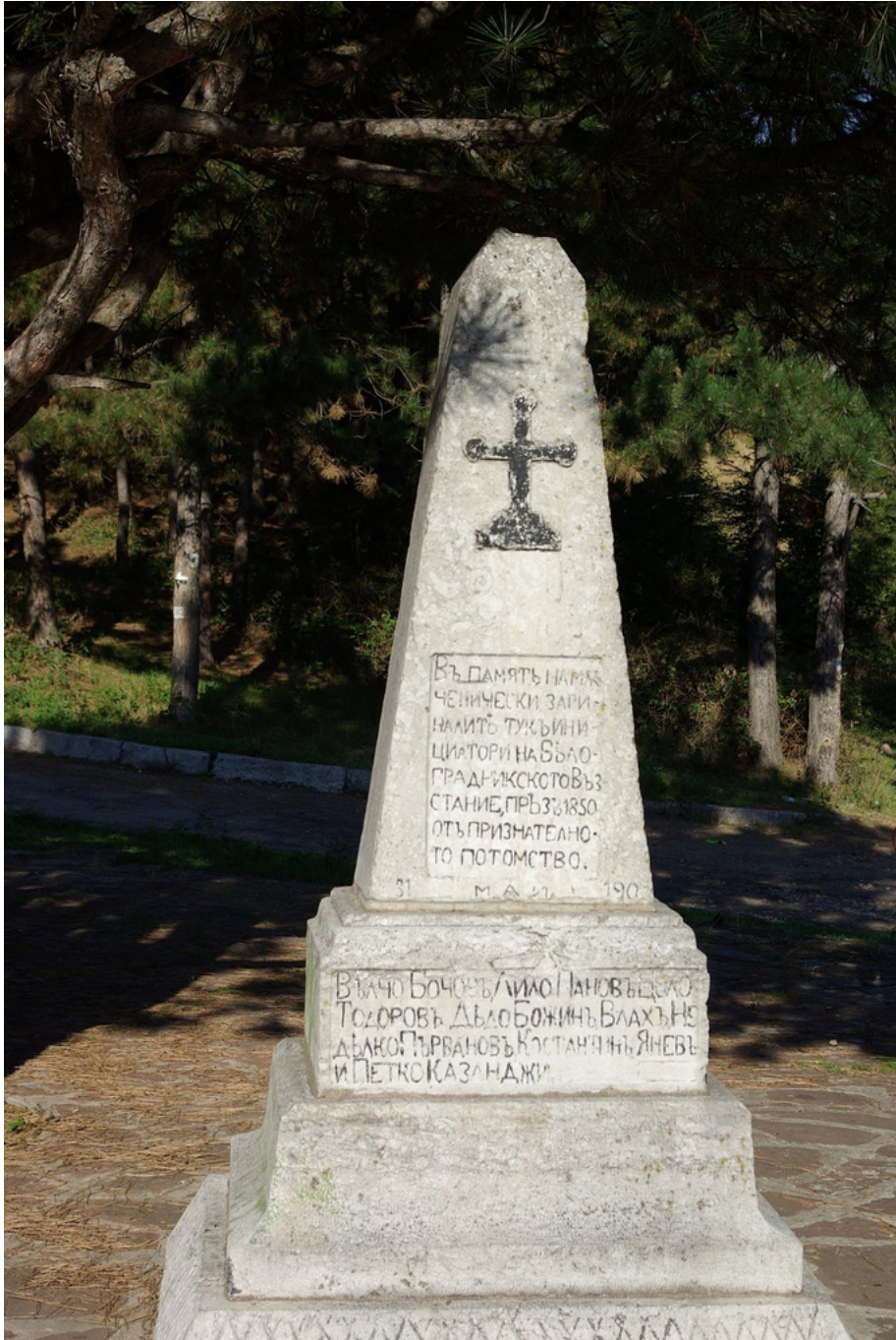
Паметникът на загиналите водачи на въстанието в днешно време (железният кръст на върха вече е откраднат)