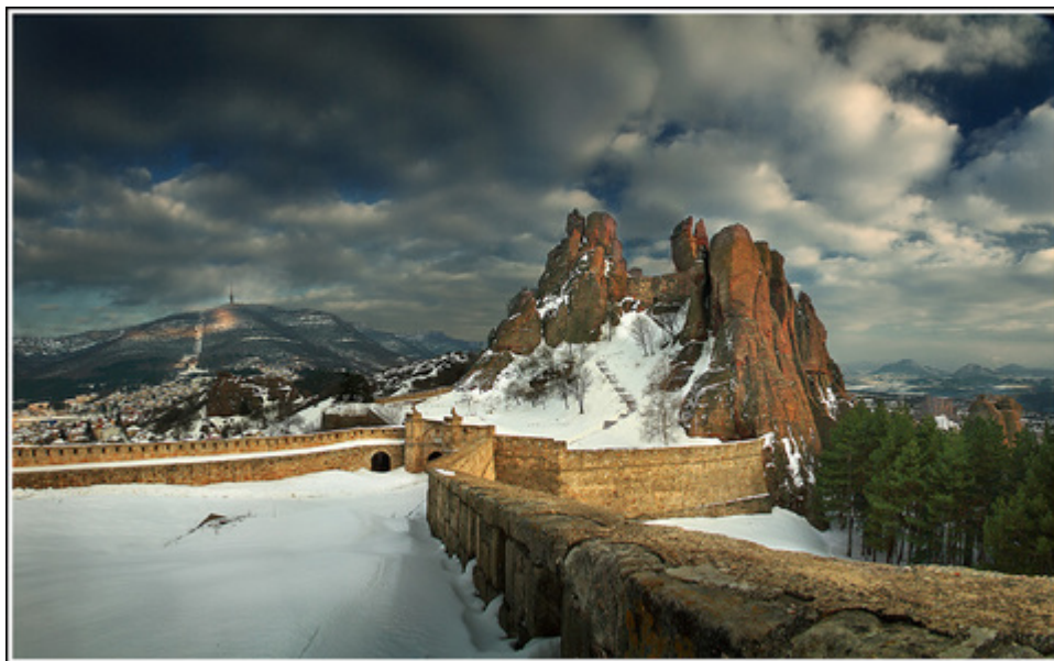
Фиг. 1. Гр. Белоградчик с крепостта

Метеоритът е паднал с ужасяващ шум в една дъбова гора, забивайки се на 1 м дълбочина, и бил с тегло 3,6 kg. Това се е случило в годината 1291 по турски, на 20 май, стар стил, или на 1 юни (нов стил) 1874 г. Събитието е станало на място, отдалечено на \frac{1}{4} час от малкото белградчишко селце Върба, което, дори 10 години по-късно, е имало едва 15 къщи (Коцев, 1884) Днес в световните метеоритни каталози този метеорит най-често се означава с името Virba, но други използвани синоними са Urba, Belgradjek, Belgrade Djik, Wirba (Prior, 1923; Grady & Graham, 2000).