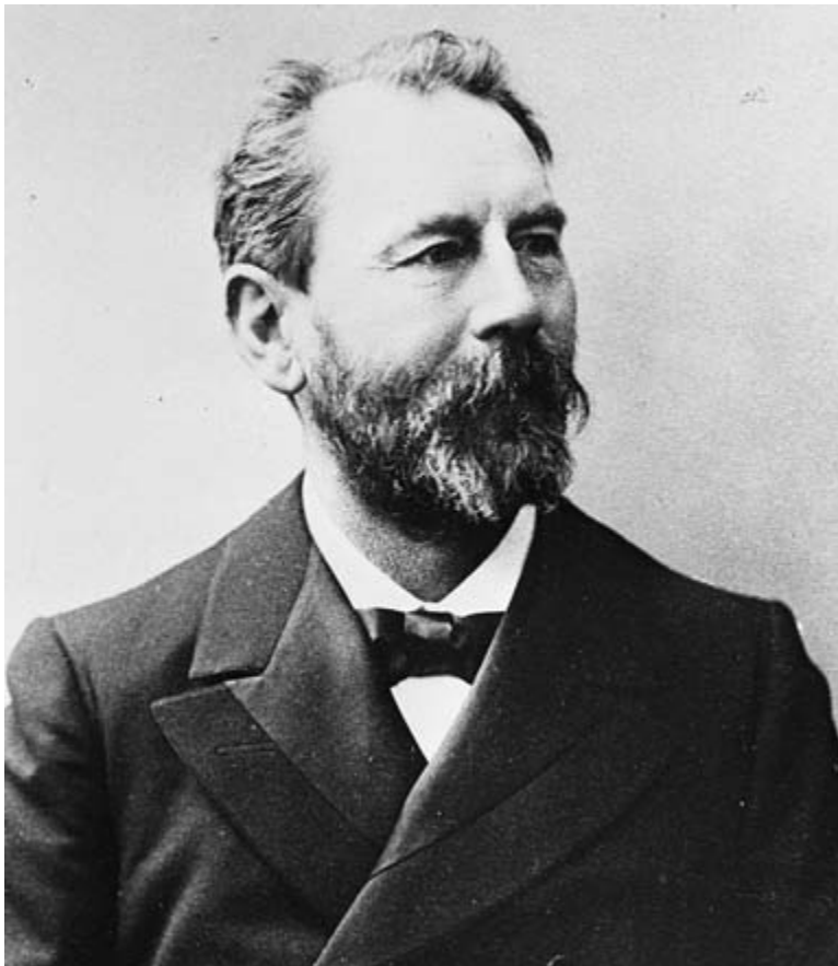
Фиг. 6. Станислас Мение (Caillet Komorowski, 2006)

Подобно на Добре и Мение има богато научно творчество – той е автор на повече от 600 публикации, между които са 30 книги. Като професор е известен със живото си въображение и младежкия си устрем в преподаването; проникателен, добронамерен и учтив – така е приетан Мение от студентите си. Мение е помощник на директора на Музея от 1910 до 1919 г., когато се е пенсиониран на 75 годишна възраст, без обаче да прекъсва научната си работа чак до смъртта си 6 години по-късно.