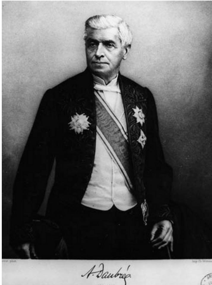
Фиг. 5. Огюст Добре (Caillet Komorowski, 2006)

Станислас Етиен Мение (1843 – 1925) от 1864 до 1892 е бил помощник на Добре в Лабораторията по геология на Националния музей по естествена история в Париж. Поради голямата обществена заетост на Добре, Мение е реалният организатор и куратор на колекциите на Лабораторията. След смъртта на Добре Мение е получил званието професор и титуляр на Катедрата по геология. Геологията на метеоритите е неговата научна област. Смята се, че след него експерименталната геология е получила статут на самостоятелна научна област.