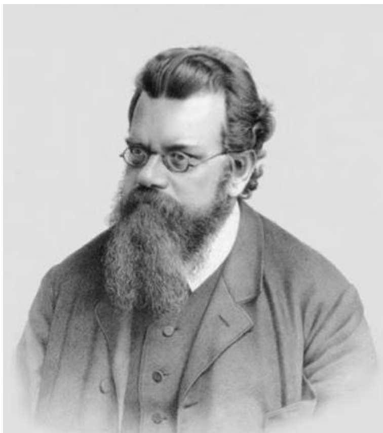
Фиг. 4. Лудвиг Болцман (1844-1906)

срещу „партия на бъдещето” (Emerson, 1841) (Фиг. 5). Тези черти на общественото и всяко друго развитие, което в исторически план е бавен, но неотменен процес, стимулираха раждането на нашето списание, което ще изследва частните случаи, но ще търси и по широките обобщения.