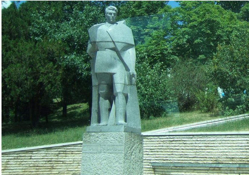
Фиг. 7. Паметник на един от централните площи на града