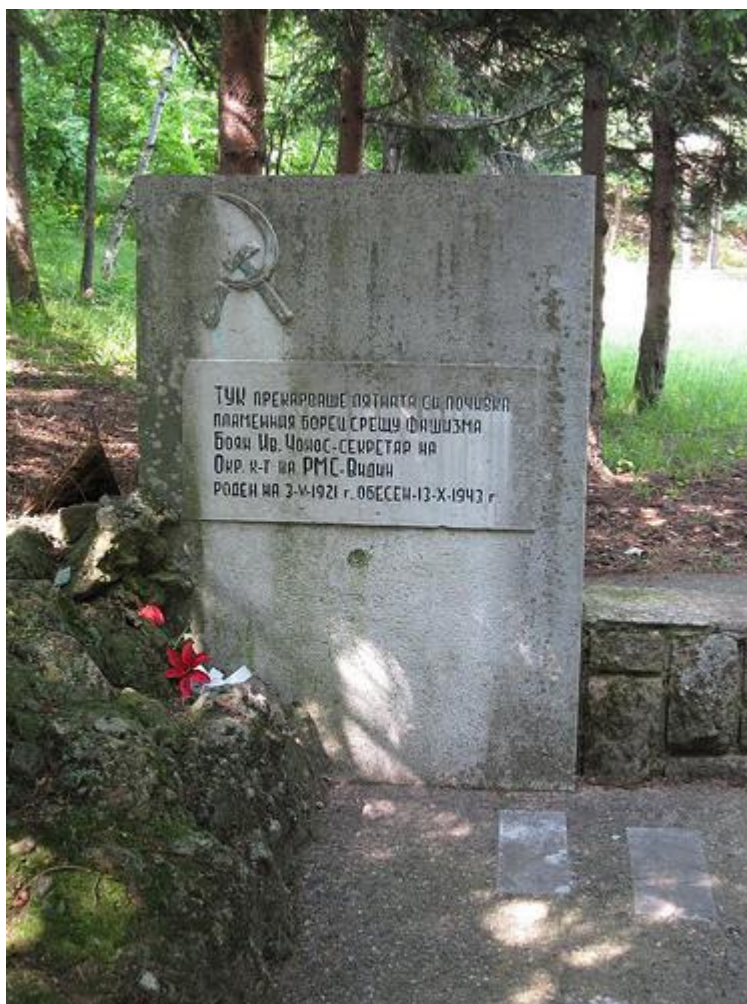
Фиг. 6. Паметник в околността на бившия Ловен дом

сметка колективната памет. Изясняването на такива взаимовръзки също е цел на нашето списание и това е трудна задача в условията на тотално фалшифицираната и подменена българска история – един процес, продължил десетилетия, довел до преекспониране на едни факти и събития и пълно игнориране на други факти и събития. Погледнете монументалните паметници в Белоградчик – те са поне три и са на хора без всякаква заслуга за развитието на града и без реален принос в националния или световния исторически процес (Фиг. 6 - 8).