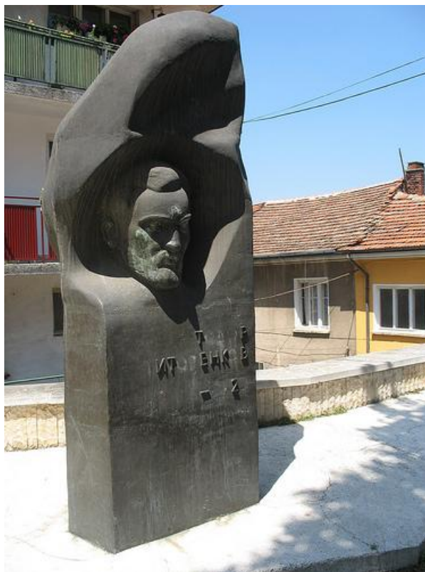
Фиг. 8. Паметник на главната улица на града