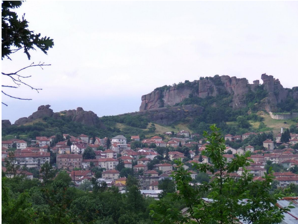
Фиг. 3. Гр. Белоградчик

„Венец”, обаче, не е краеведско списание. Краезнанието („краеведение”) според руските източници има за цел пълното изучаване на определен район, град, село и дори част от населено място, в което участват както професионални историци, архивисти, демографи, фолклористи, етнографи, музейни куратори и други специалисти, така и местни ентузиастични патриоти, ученици, учители, пенсионери. Основателно професионалните историци изпитват известно недоверие към дилетантите – краеведи, защото тяхната събирателна и проучвателна дейност най-често е белязана с хаотичност и непознаване на основните инструменти за такъв род проучвания. Освен това техните оценки на определени исторически събития или факти не рядко са далеч от истината, защото тези хора много често, поне в България, а навярно и