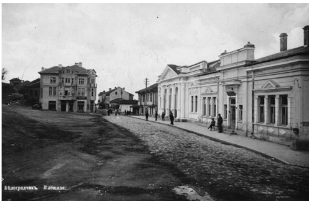
Театърът и Офицерското събрание