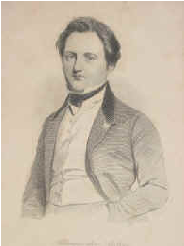
A.-J. Blanqui (1798-1854)