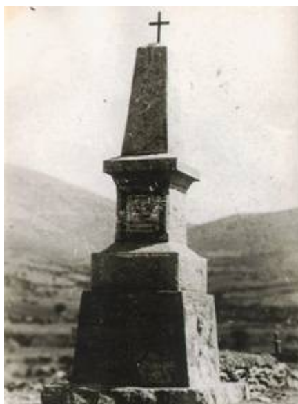
Лобното място на полковник Каварналиев