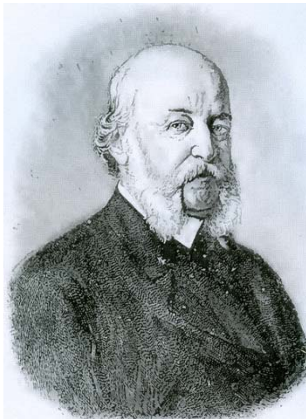
Felix Kanitz (1829-1904)

Тогава всяка вечер хора ще се трупат на „Мислен камък”, в борвата култура из парка „Борис III”, на „Писана бука”, на „Кучешкия камък”, из хубавото дефиле, дето се мъдрят няколко самородни статуи. Хиляди хора ще излизат на разходка до „Субашин” и други места. На „Кърнина ливада” и „Поплилов камък” ще се качват ежедневно млади туристи, за да се любуват на хубавата гледка и на слънчевия заник, а от „Венеца” – от „Смедерев връх” ще дочакват изгрева на слънцето и ще гледат тихия бял Дунав как лъкатуши между равна Румъния и Бдинското поле. На „Банова глама” с хубавата котловина, гдето е построена модерната свинарница, с приветливата до нея къща, годна за летовище на дачници, ще квартируват такива. На прохода „Столове”, където е построен общинския дом за почивка, ще бъде поставен голям фенер – фар, за да