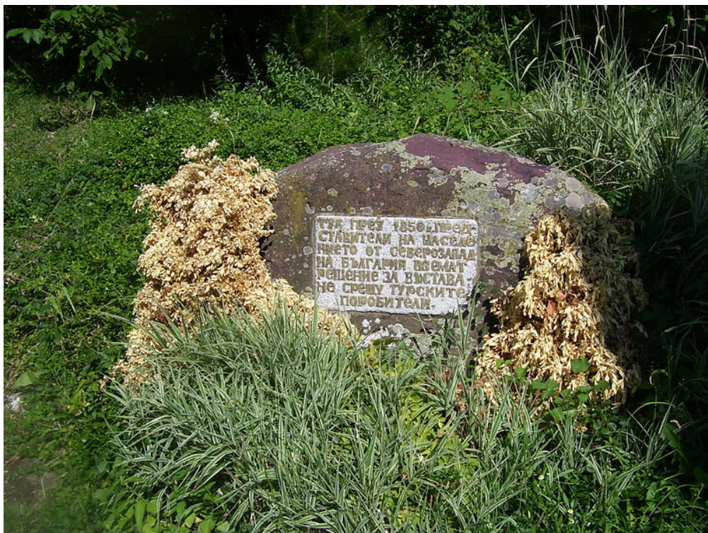
Паметен знак за Първото народно събрание

- Стига толкова бе, братя! Търпели деди, прадеди, и ние ли да търпим?