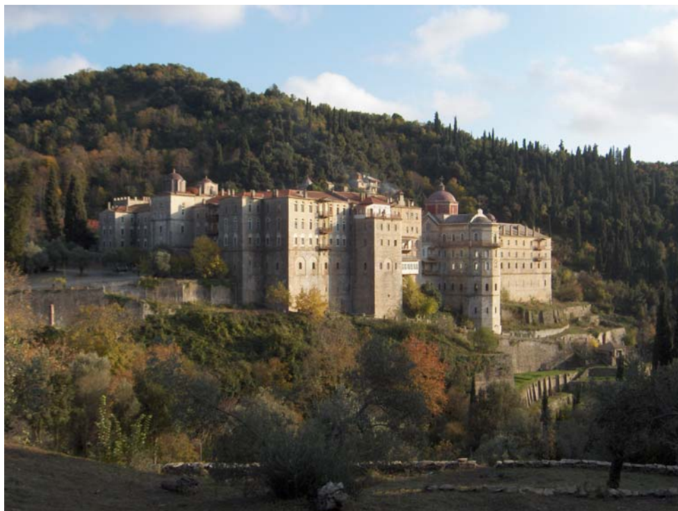
Български манастир “Св. Георги”, Света гора

агарянциите. Сладкодумни монаси умееха да увлекат простите и наивни слушатели със сърдечния си разказ. Те самите вярваха в чудесата, за които говореха, а слушателите благочестиво се доверяваха. Слушаха като замаяни и заковани. Изрядко поклащаха глави, ахкаха от удивление и по примера на набожните калугери се кръстеха просто и чисто.