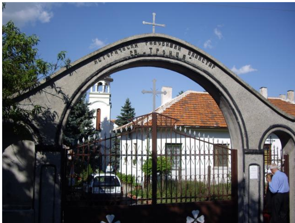
Манастир “Св. Троица” в Раковица

общо, народно. Те чувстваха величието и възвишеността на това общо и неизбежно нещо, но още не можеха да го назоват. Някои го наричаха сбунна и влагаха в тая къса и изразителна дума чувството си на жертвеност и привързаност към народа и земята. Това чувство се свързваше и с предчувствието за някаква опасност, която неминуемо ги следва от тоя ден нататък. Тук-там някои се знаеха. Повечето сега се опознаваха. Седяха един до друг без стеснение и се опитваха кой от къде е. Завързваше се естествен разговор, който стигаше до злото. И в гълчавата, която растеше с новите гости, се отсичаха решителни и уверени думи: