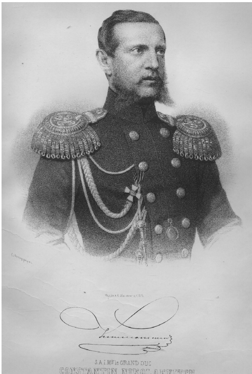
Великият княз Константин Николаевич

- От Видинския вилает, твоя царска милост.