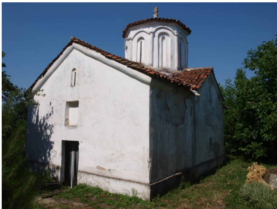
Старата манастирска черква